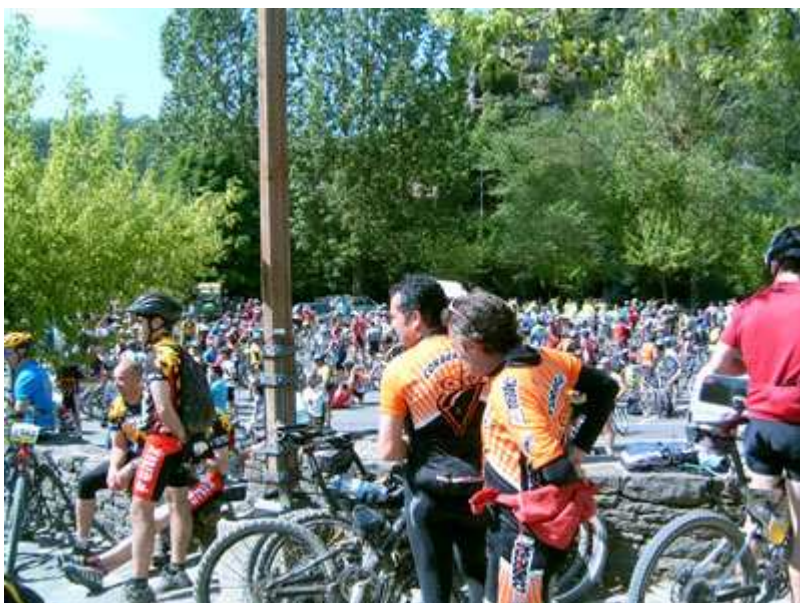
Parada para almorzar en Rupit