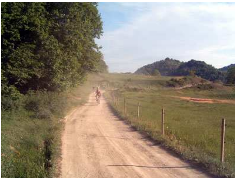
Vistas del recorrido