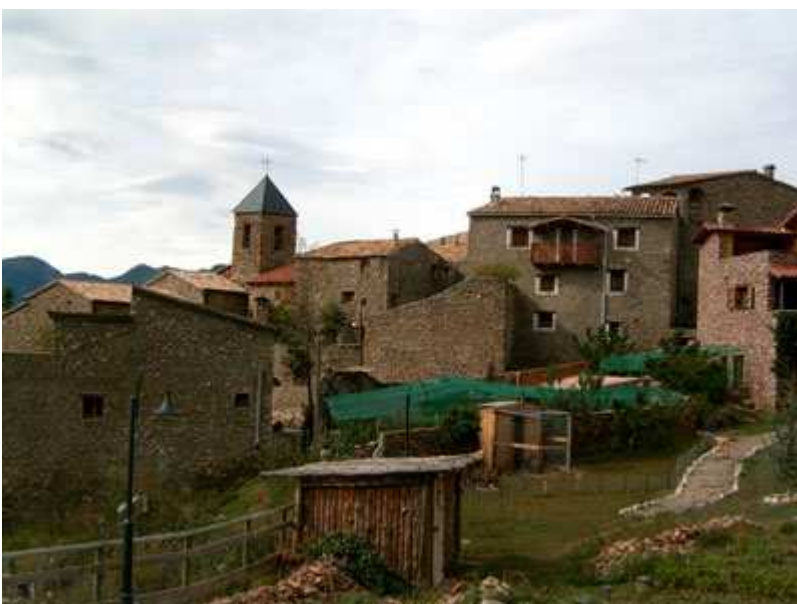
Pueblo de Fòrnols