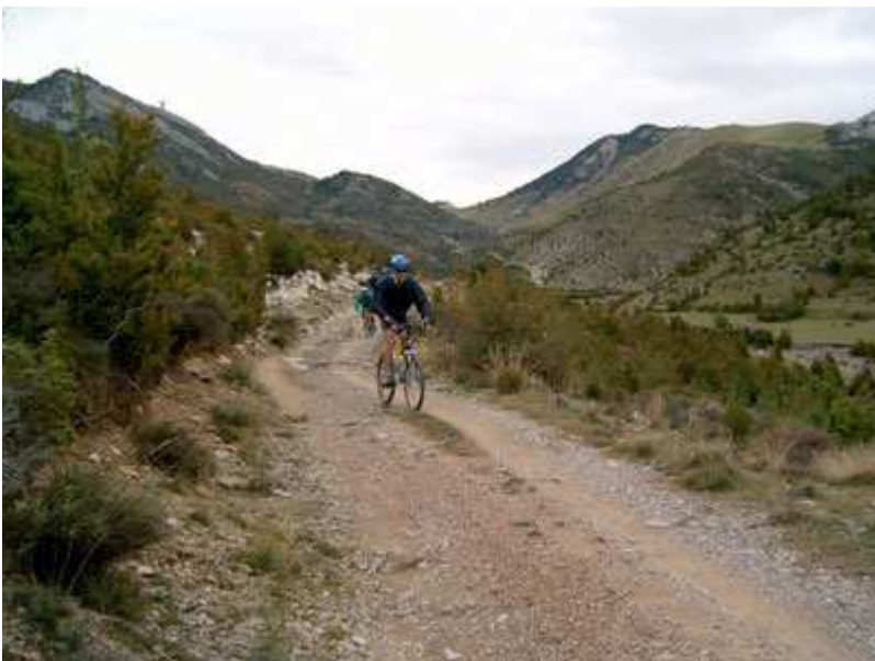
Descenso hacia Josa