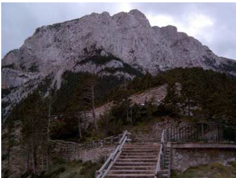
Macizo del Pedraforca visto desde el mirador