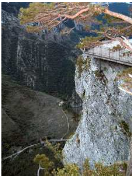
Mirador de Gresolet