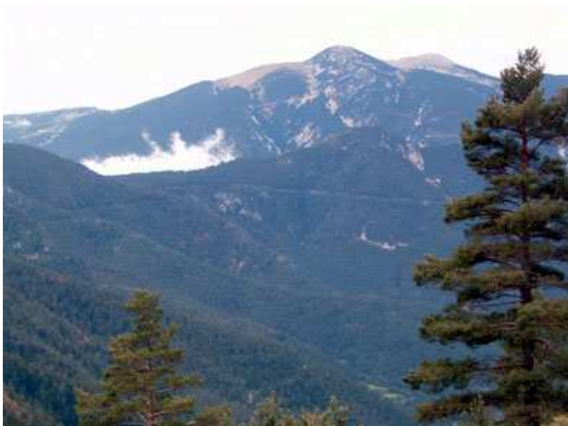
Vista general de los bosques por los que transcurren las pistas