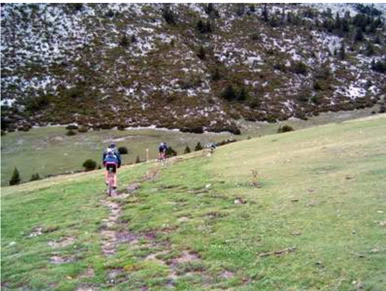
El grupo hacia el río de Cernerres