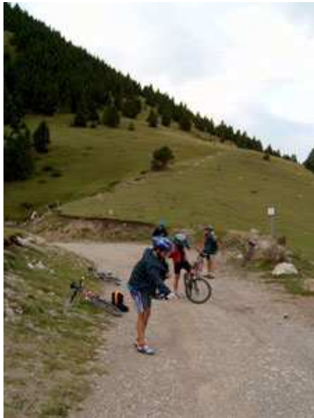
En el Collell preparándonos para iniciar el descenso