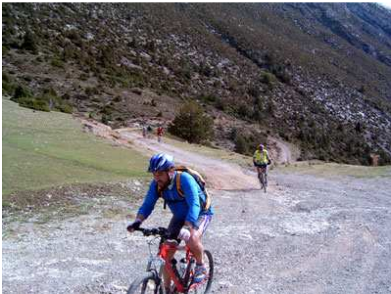
Llegada al alto del Coll de Jovell (2º Puerto)