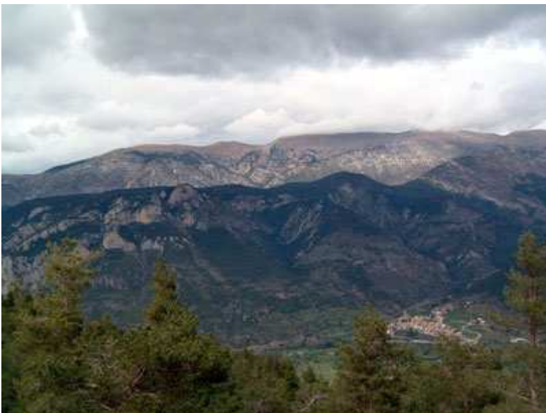
Vista de Tuixén desde el Coll de Port (3er. Puerto)