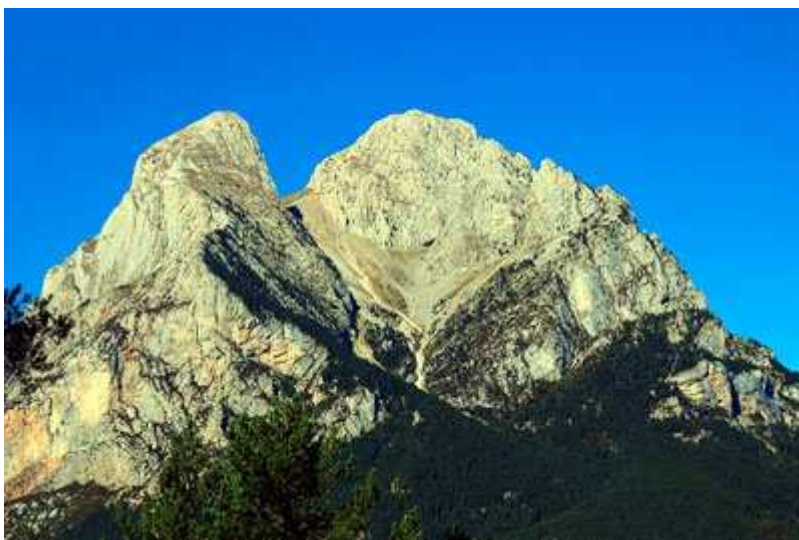
El Pedraforca

Catalana (la propuesta en su libro por Jordi Laparra), tramo que en la actualidad está asfaltado y que hemos mejorado subiendo al Coll de Jovell por pista forestal. Es una ruta que se realiza prácticamente en su totalidad por pista forestal, son muy pocos los kilómetros que se realizan por asfalto (aunque cada vez más el asfalto va comiéndose las pistas forestales). Todo ello junto hace que esta ruta tenga todos los ingredientes necesarios de una "Clásica" que me gustaría presentarte.