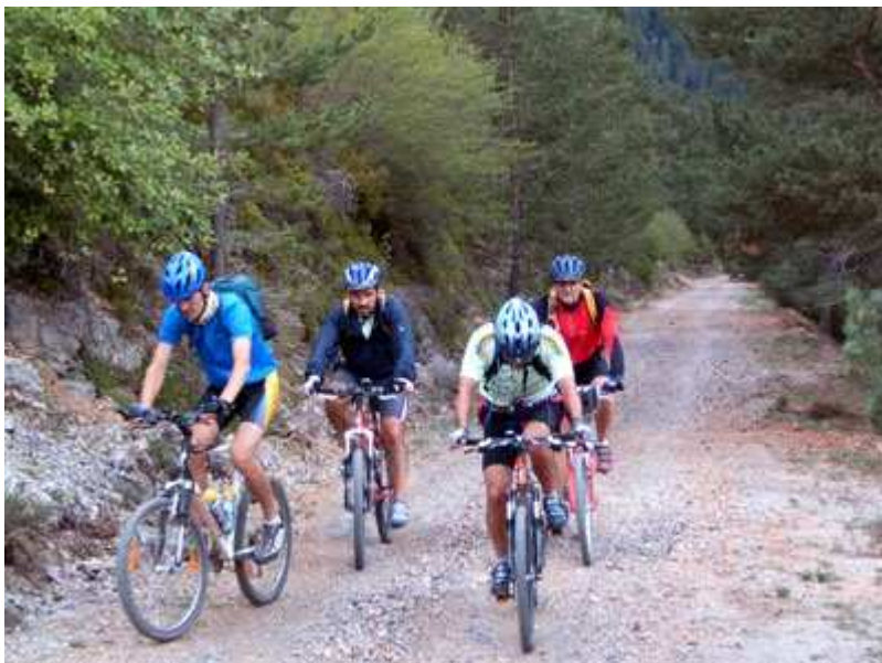
En dirección al Coll de Mola.