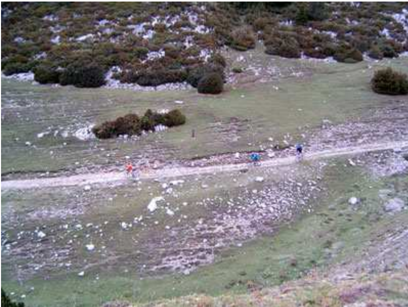
Por la Coma de Cernerres