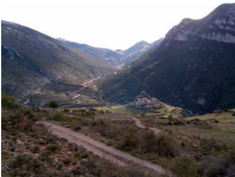
Vista de Josa y el valle de Cernerres