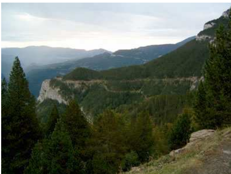
Pista del mirador de Gresolet al Coll de Collell