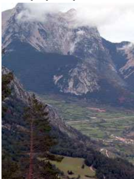
Vista de Gósol desde el Coll de Mola (4º Puerto)