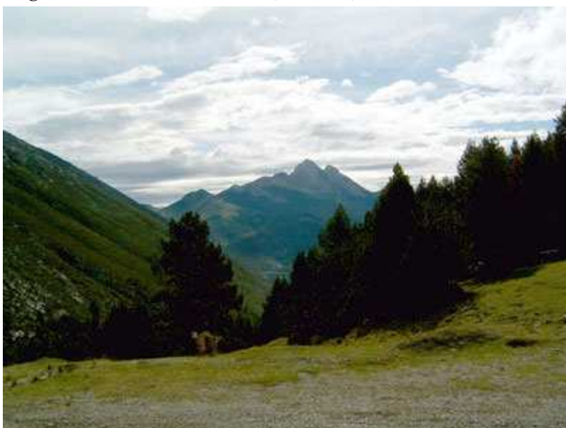
Vista del Pedraforca desde el Coll de Jovell