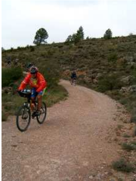
Descenso desde Fòrnols al Molí de Fòrnols