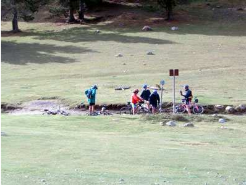
En el Coll de Jovell preparando el descenso