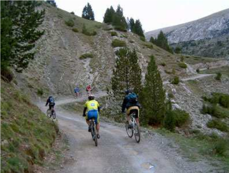
El grupo en las proximidades del Coll de Collell (1er puerto)