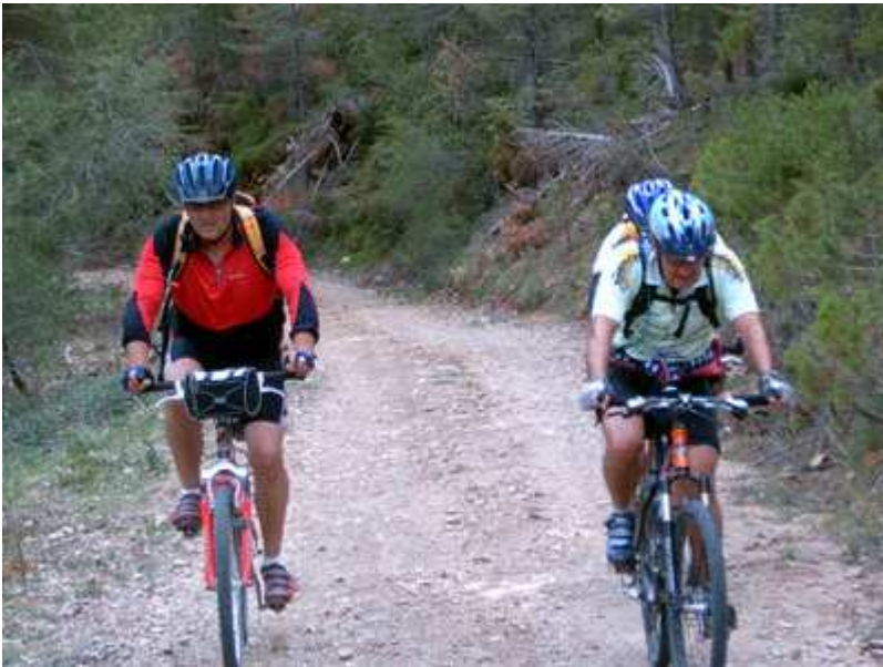
Pistas por la Obaga Negra, dirección al Coll de Port