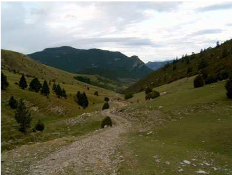
Vista general de la Coma de Cernerres