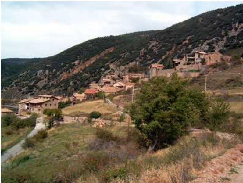
Pueblo de Cornellana