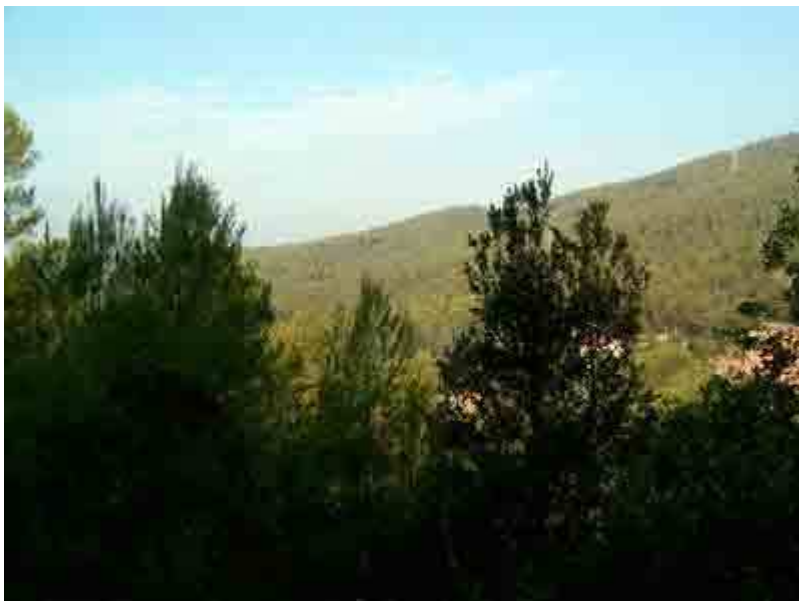
Vista de la Serra de Can Julià y casas de Can Castellví