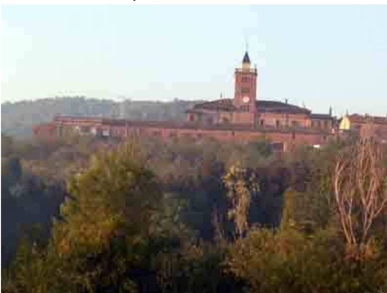
Vista general de Can Montmany

del campo. Sendero poco definido y ocupado por los arbustos, hasta que poco a poco se va ensanchando , dando lugar a un camino que bordeará Can Montmany.