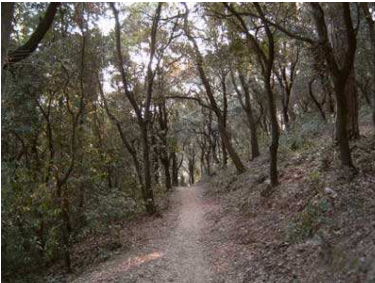
Sendero que va a salir a la carretera BV1418