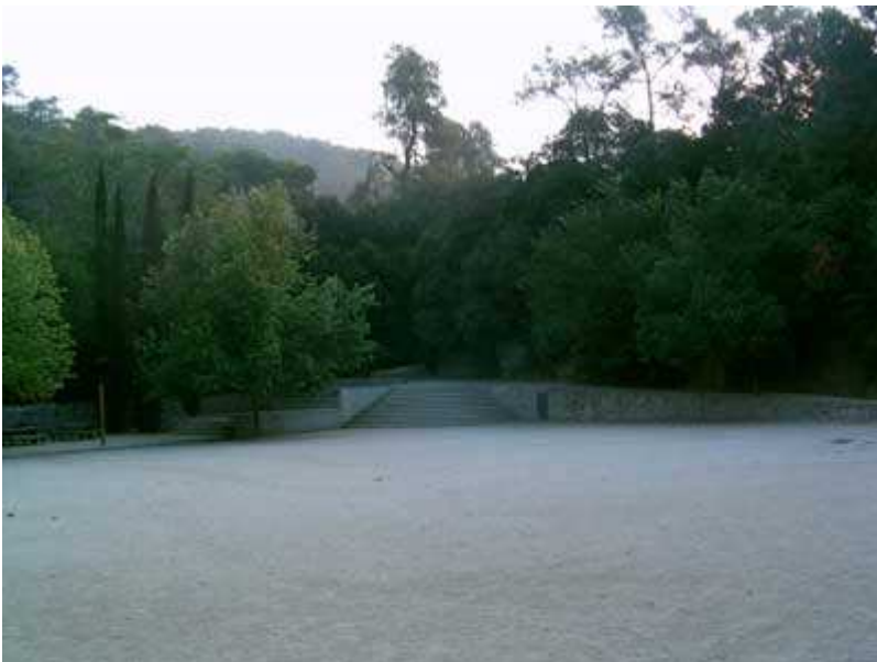
Area de recreo de Santa María de Vallvidrera