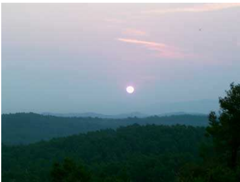
Amanecer sobre Collserola

Esta excursión la he realizado en solitario, una mañana de verano que no podía dormir.