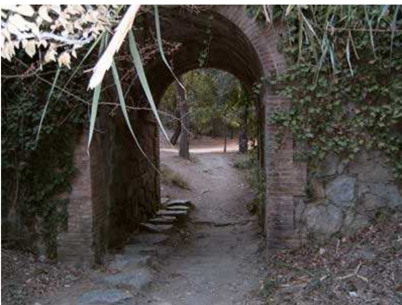
En esta época el torrente de la Font del Canet está seco http://www.bttysenderismo.com

delante de Can Bosquets y donde una vez pasado, se convierte en un sendero que nos hará subir por la sierra de Can Balasc. Es el punto más difícil de la excursión, por tener mucha piedra suelta, ser estrecho y alcanzarse las máximas pendientes de subida (+25,81%). Una vez superado el Coll e iniciado el descenso, se vuelve a convertir en pista ancha, que pasa por delante de la Estació Biològica de Can Balasc. Esta pista desemboca en la pista que viene de la carretera y que se dirige a las casas del Turó de l'Alzinar. Desde aquí, haciendo un cambio de pistas (seguir el Track sobre el mapa), se llega a la urbanización de Can Sauró y al área de recreo de Santa Maria de Vallvidrera. Fijaros en el Track, pues no sigo la carretera, sino que paso por unos senderos y caminos paralelos a la carretera y al torrente de la Font del Canet, el cual se ha de cruzar en algún punto, aunque en esta época está seco. También se encuentran robles de un tamaño considerable.