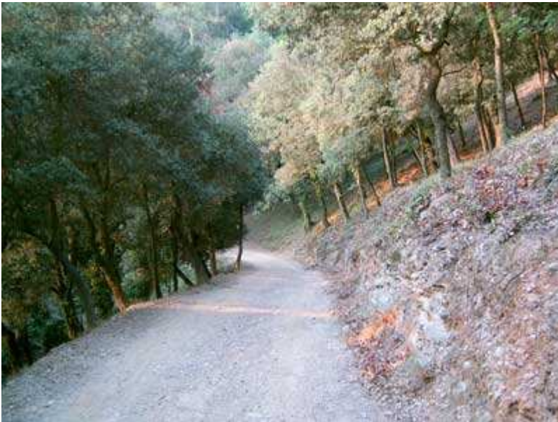
Ladera del Turó de l'Alzinar