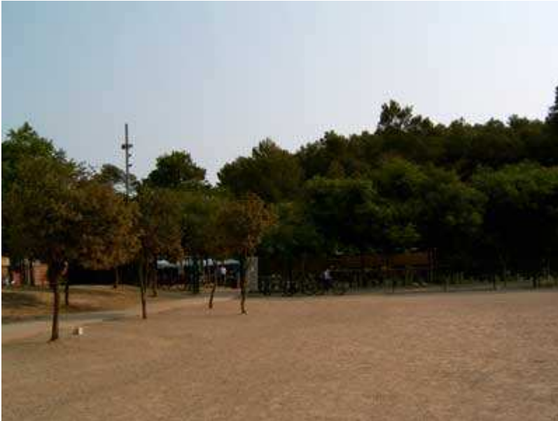
Area de recreo de Can Coll