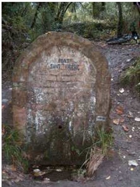
Font de Sant Vicenç