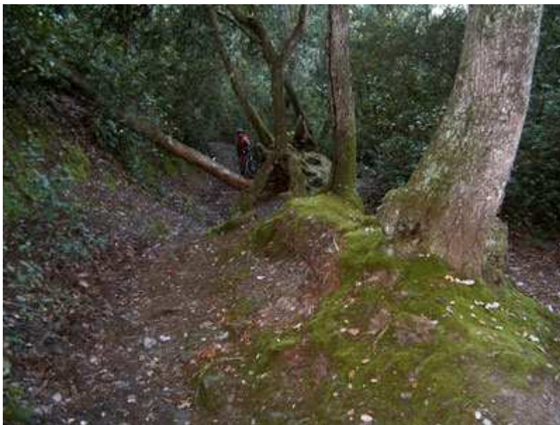
Sendero de bajada a la Font Groga