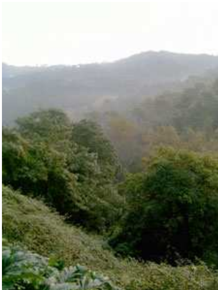
Vista desde el sendero de Can Puig