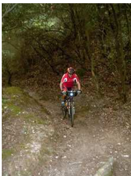
Albert por el PR C-38

Una vez que salimos a Can Puig hemos de seguir la pista asfaltada, hasta la carretera de Sant Cugat, en Can Ribes, donde tomaremos un camino ancho que pasa por el viaducto de Can Ribes, y que poco a poco se irá convirtiendo en un sendero, que recorrerá toda la sierra de l'Arrabassada hasta dejarnos en Can Borrell. Es un sendero con mucha roca y fuertes pendientes de bajada, que obligan a bajar de la bici, especialmente si la roca está húmeda.