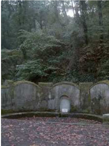
La Font Groga