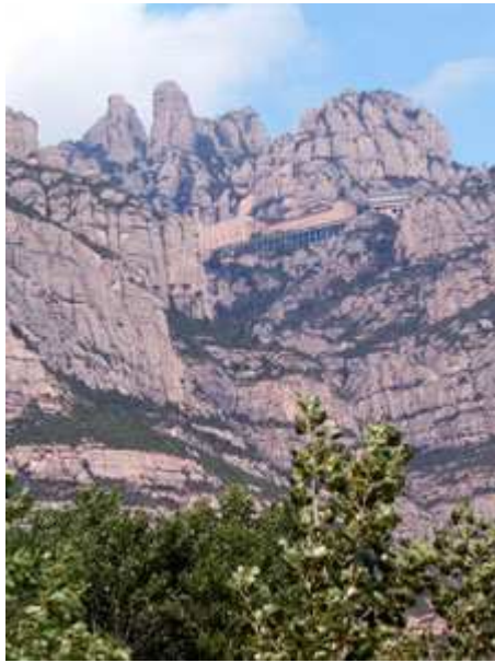
El Monasterio de Montserrat, visto desde el Llobregat