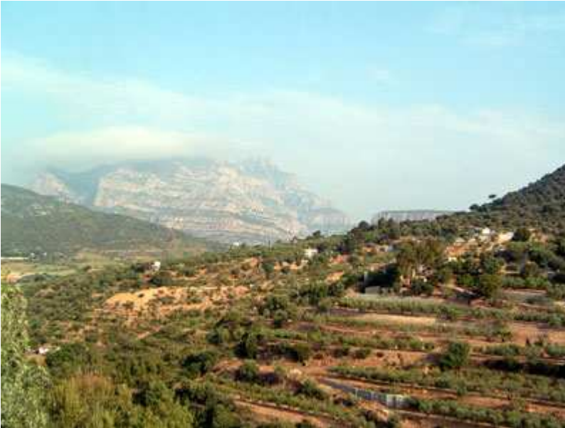
Se ve Montserrat