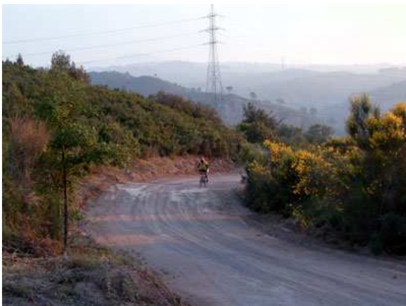
Subida del torrente de Pagueras