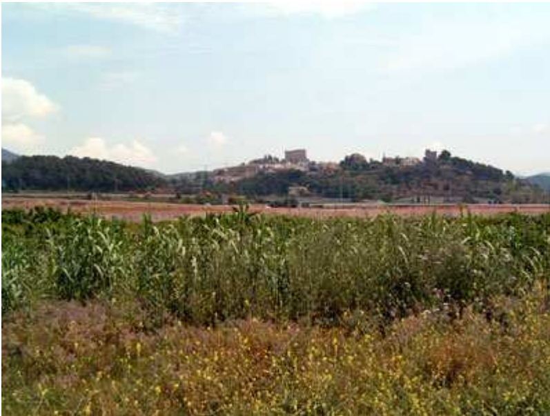
Llegamos a Papiol