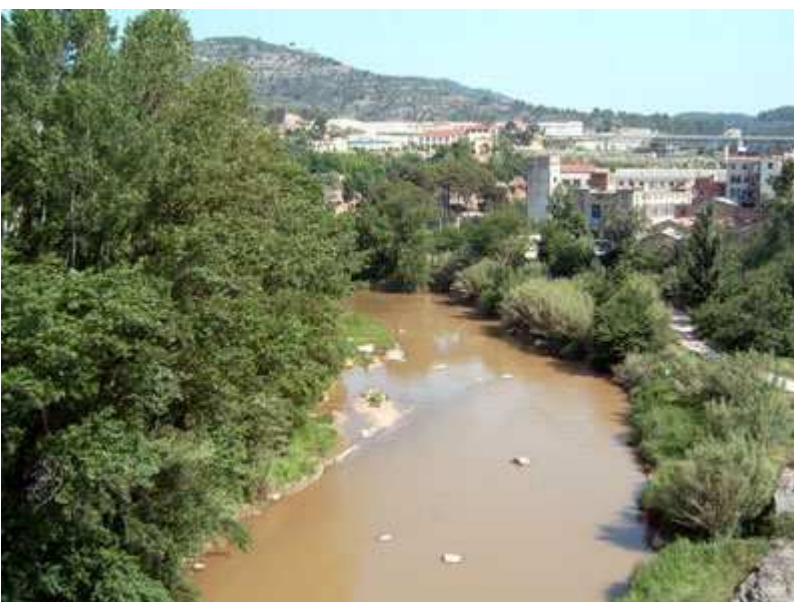
El río Llobregat a su paso por Monistrol http://www.bttysenderismo.com

pista que va tomando altura con relación a la carretera para luego bajar hasta el río Llobregat, por una pista llana y paralela al mismo, llena de árboles que nos llevan hasta Monistrol, donde tomamos un merecido almuerzo.