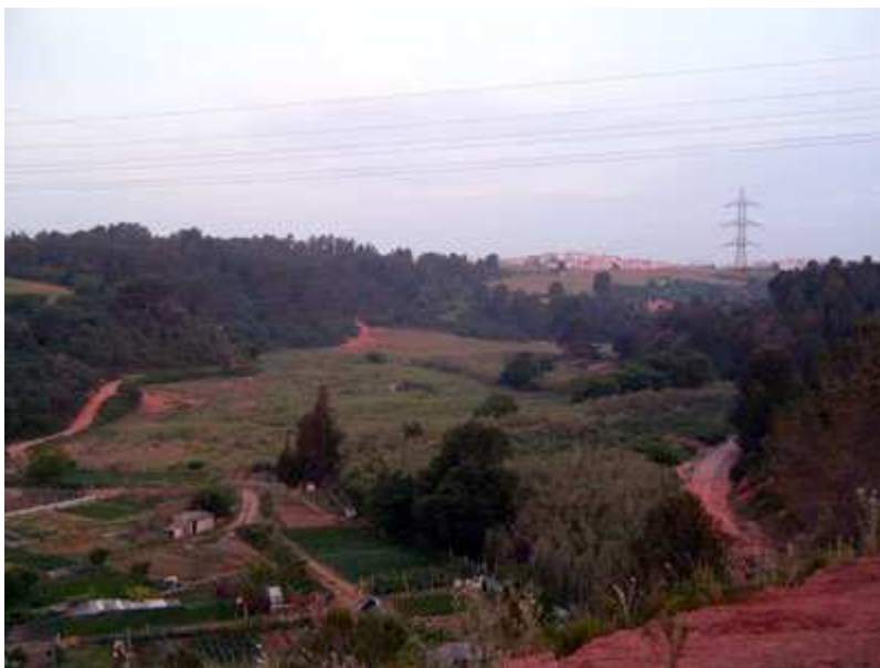
Vista de Castellbisbal

El Papiol- Coll d'en Faura - Serra de Roques Blanques - Castellbisbal - Can Nicolau de Dalt - Ca n'Ametller - Ullastrell - Rierada del Morral del Moll - Mas d'en Ribes -Urbanización Ribes Blaves - Les Planes (Olesa de Montserrat) - La puda de Montserrat - Rio Llobregat - Monistrol - Rio Llobregat - La puda de Montserrat - Olesa de Montserrat - Ctra de "Las Carpas" (La antigua carretera a Martorell)- Cuesta Blanca - Rio Llobregat - El Papiol.