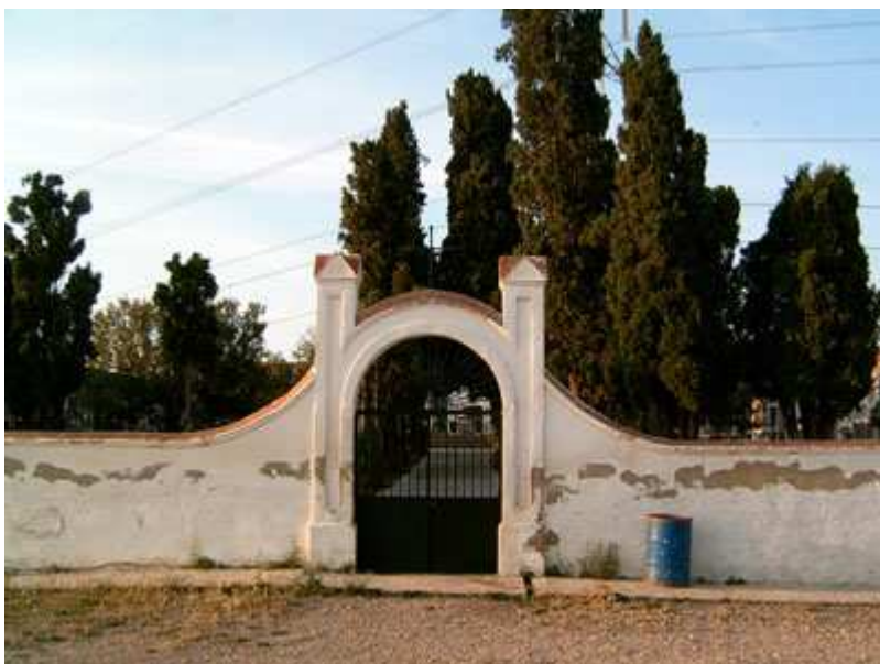
Cementerio de Ullastrell