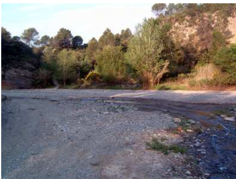
Cruce de la Riera del Morral del Moll