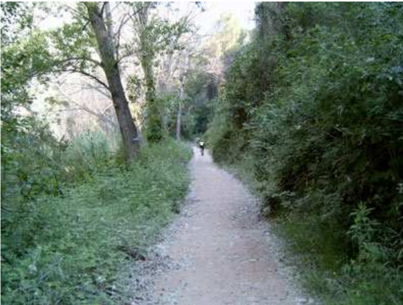
Por la pista de llegada a Monistrol, paralela al río