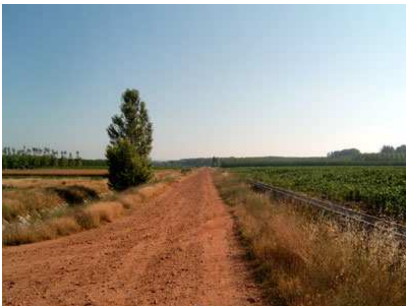
Camino de concentración parcelaria