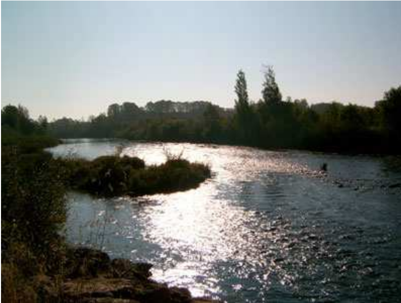
Amanecer en el río