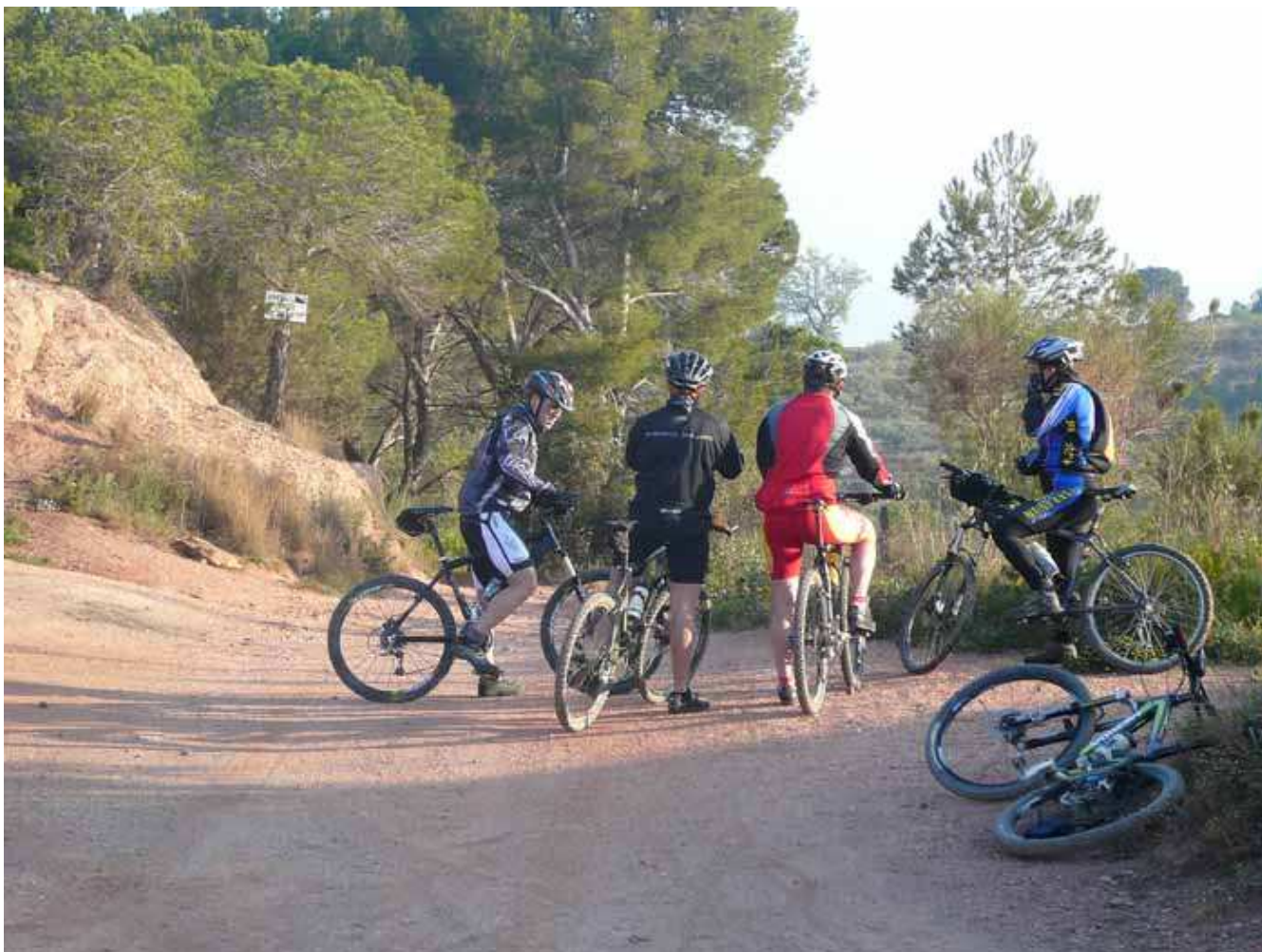
El grupo en una de las paradas de la ruta.