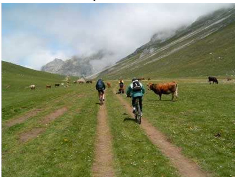
Puertos de Áliva.

nuestros respectivos GPS, una pequeña ruta para conocer la zona y empezar a preparar las piernas para el día siguiente. Esta ruta consistía en subir por pista forestal el puerto de Panderruedas y bajar por la carretera comarcal, con un recorrido total de 22,9 km y un desnivel acumulado de 852m. La pista sale del mismo centro de Posada y coge rápidamente altura por la loma del Monte Redondo, con fuertes pendientes (alcanzan el 33%) que la hacen muy dura durante los primeros 2 km, una vez que ha cogido altura se suaviza mucho, aunque siempre tendrá tendencia a subir. Una vez cogida altura se puede disfrutar de los preciosos bosques por los que transcurre la pista, hasta que la pista se cruza con la carretera en el puerto de Panderruedas. Desde aquí es una fantástica bajada hasta el hotel por una carretera comarcal muy poco transitada.