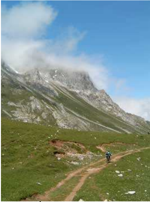
Puertos de Áliva.