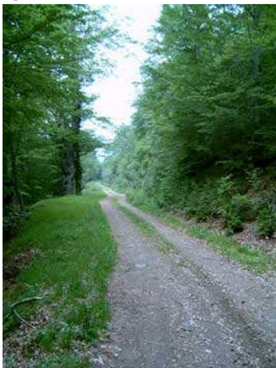
Pistas por el puerto de Panderruedas