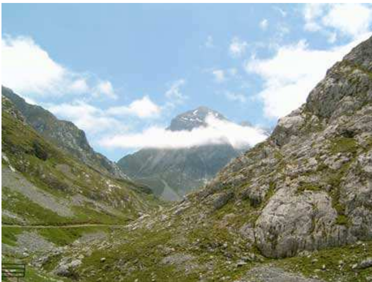
Descenso de los Puertos de Áliva

unos 3 km, en el Bar Nevandi. Eran las 11 h de la mañana y pedimos carne guisada con pimientos rojos y patatas fritas, nos pusieron una bandeja tan grande que sobró la mitad. Ni que decir tiene que ya no comimos nada hasta la hora de la cena. Justo en el Nevandi, sale la pista que hemos de seguir, pista forestal con fuertes pendientes que te obligan a adelantar el cuerpo lo más cerca de la rueda delantera para que no se levante. Es una pista incomoda por que te obliga a hacer continuos equilibrios para no ir con el pie a tierra. Esta pista sube hacia la zona conocida como Puertos de Áliva. Una zona preciosa. Seguimos por la pista que nos lleva a la Ermita de la Santuca de Áliva.