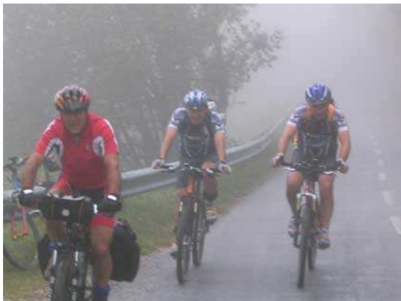
Iniciamos el día subiendo el puerto de Pandetrave