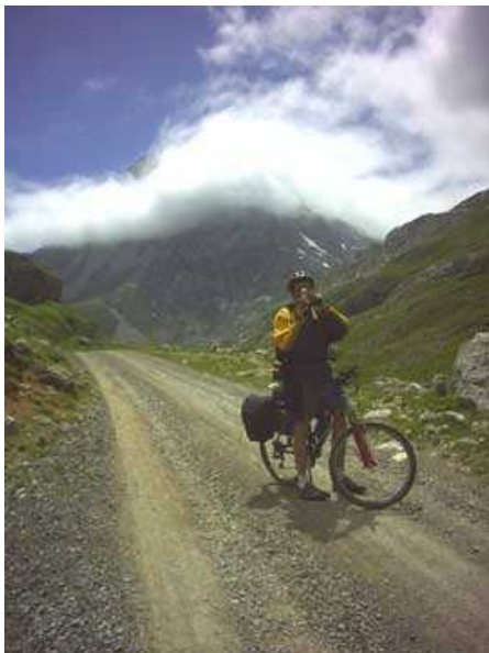
Una foto en los puertos de Áliva