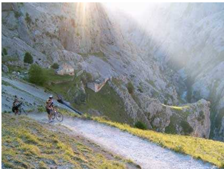
Garganta del Cares.