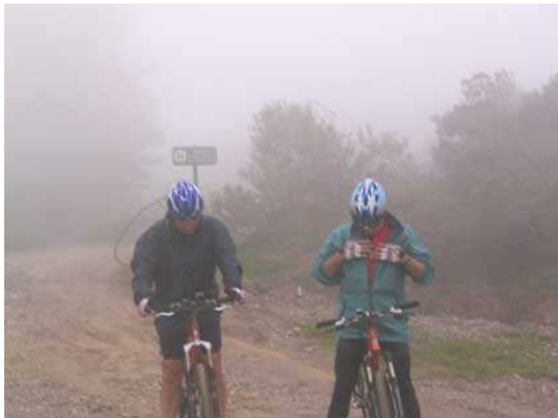
Puerto de Panderruedas. Cambio climático