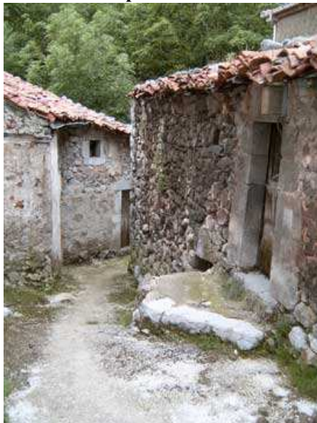
Un rincón de Tielve