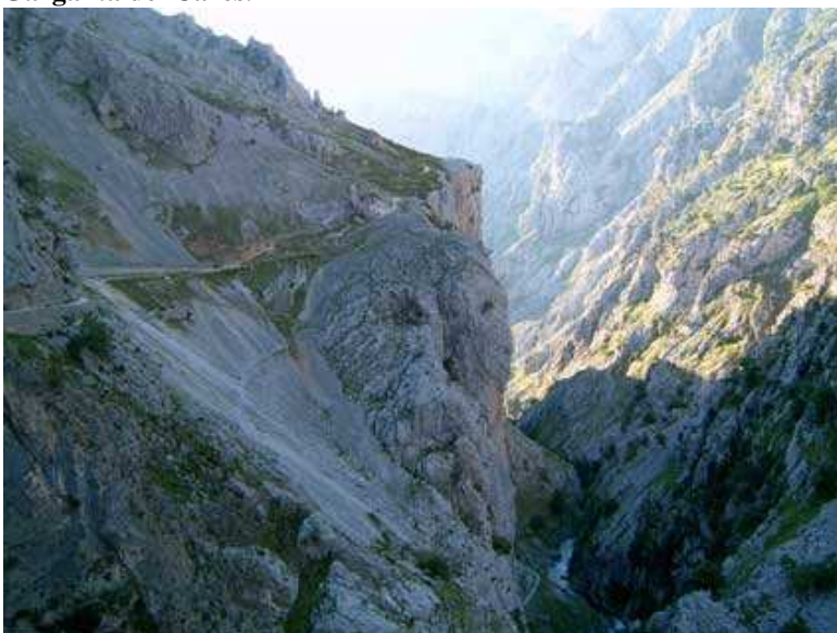
Garganta del Cares.