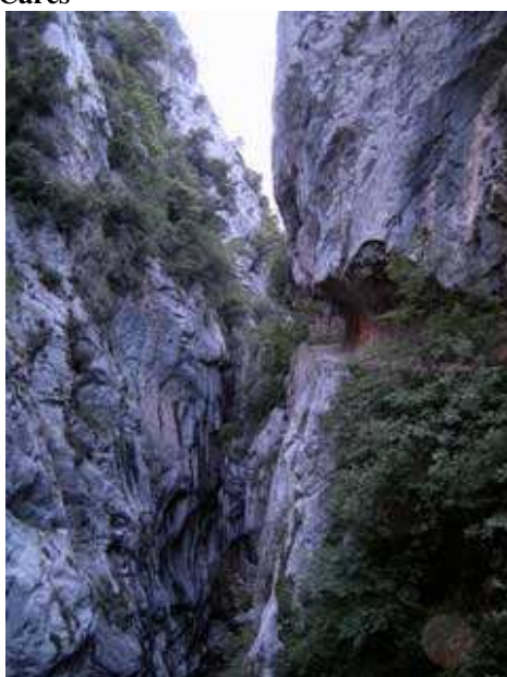
Garganta del Cares

Los cuatro protagonistas de la excursión.