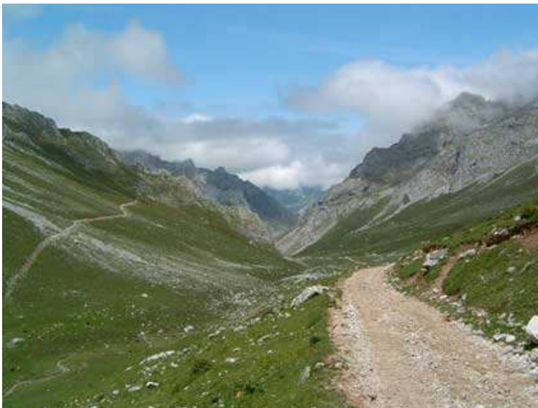
Puertos de Áliva