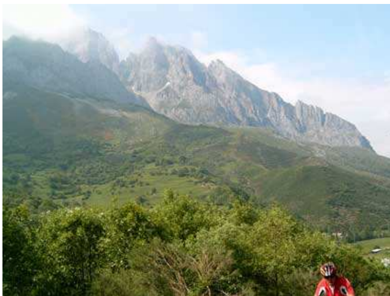
Ascensión al puerto de Panderruedas

Posada de Valdeón - Puerto de Panderruedas - Posada de Valdeón - Puerto de Pandetrave - Horcada Valcavao - Fuente Dé -Espinama - Puertos de Áliva - Tielve - Poncebos - Garganta del Cares - Caín - Posada de Valdeón.