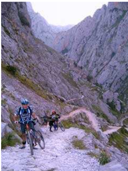
Garganta del Cares