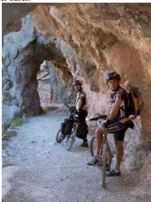
Garganta del Cares

los aldeanos cazaban los lobos para matarlos.