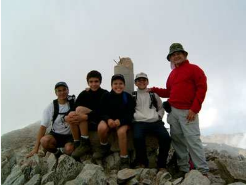
Foto del grupo con el objetivo conseguido. Pic de Bastiments