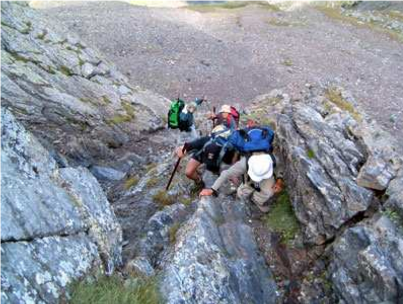
En numerosas ocasiones hay que agarrarse a la roca.