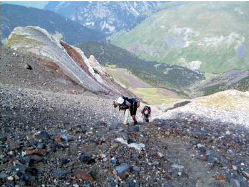
La pendiente es muy pronunciada.