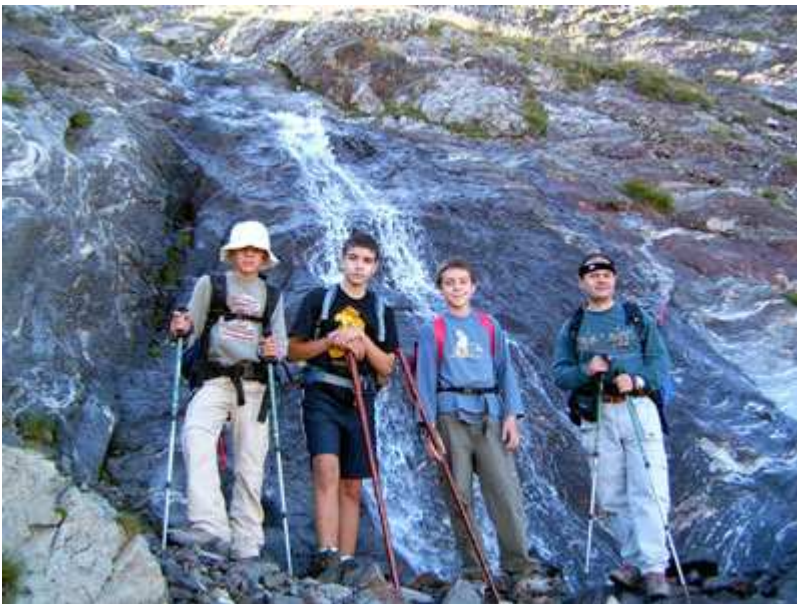
Los protagonistas en el cruce de un torrente.