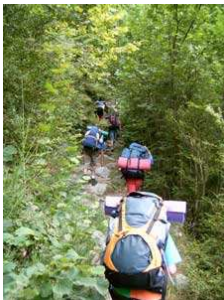
Subiendo por senderos estrechos y frondosos