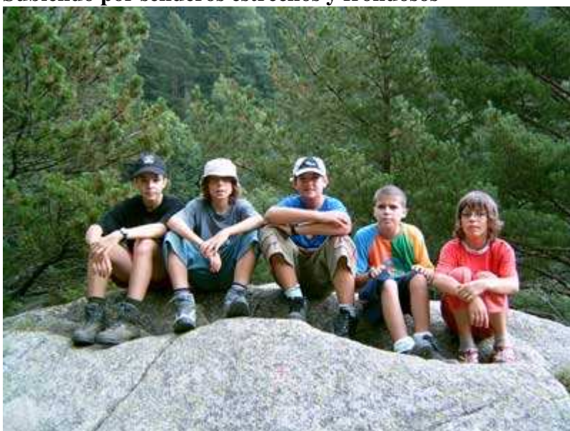
Un alto en el camino