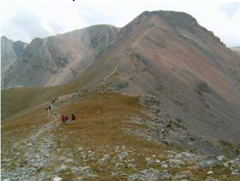
Pic Superior de la Vaca. Frontera con Francia