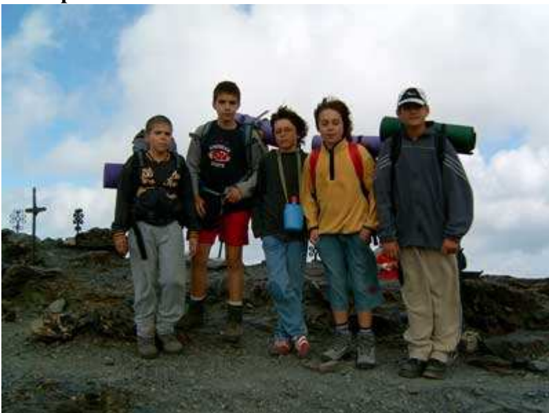
En el Coll de Nou Creus