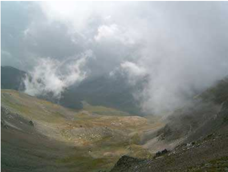
Coma de la Vaca y Serra del Torreneules