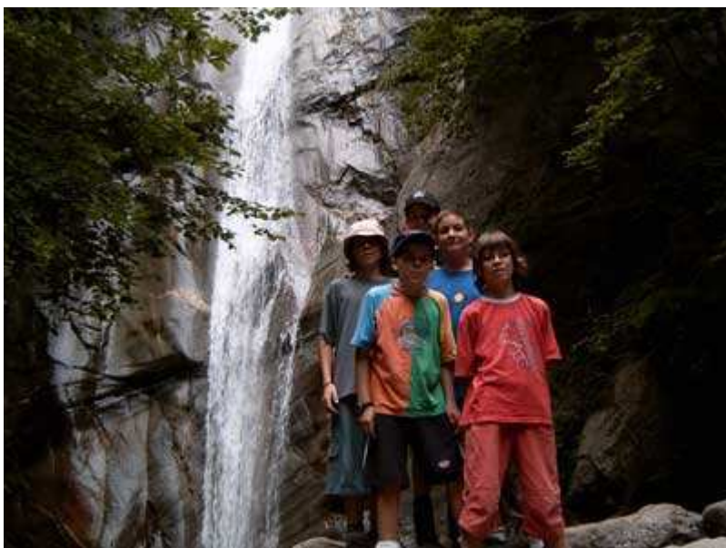
En salto del Grill

Cuando ya llevamos aproximadamente 2,5 km de recorrido, llegamos a una fantástica cascada, llamada del Grill, en la cual hicimos una parada y tomamos unas fotografías.