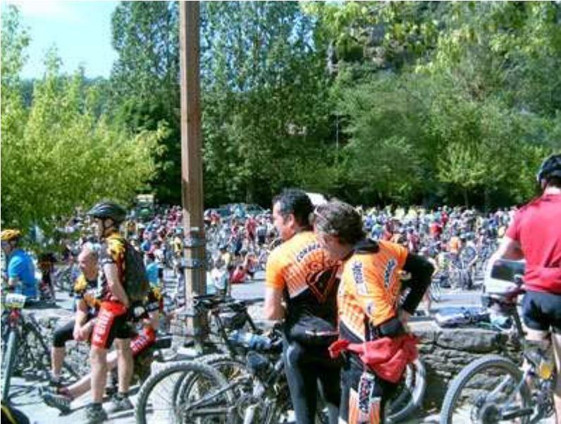
Parada para almorzar en Rupit