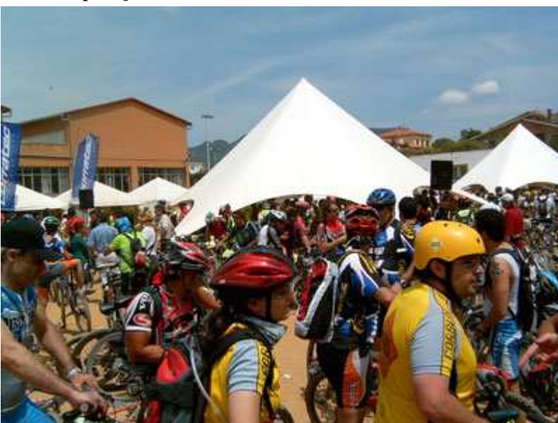
A la llegada entrega de recuerdos http://www.bttysenderismo.com