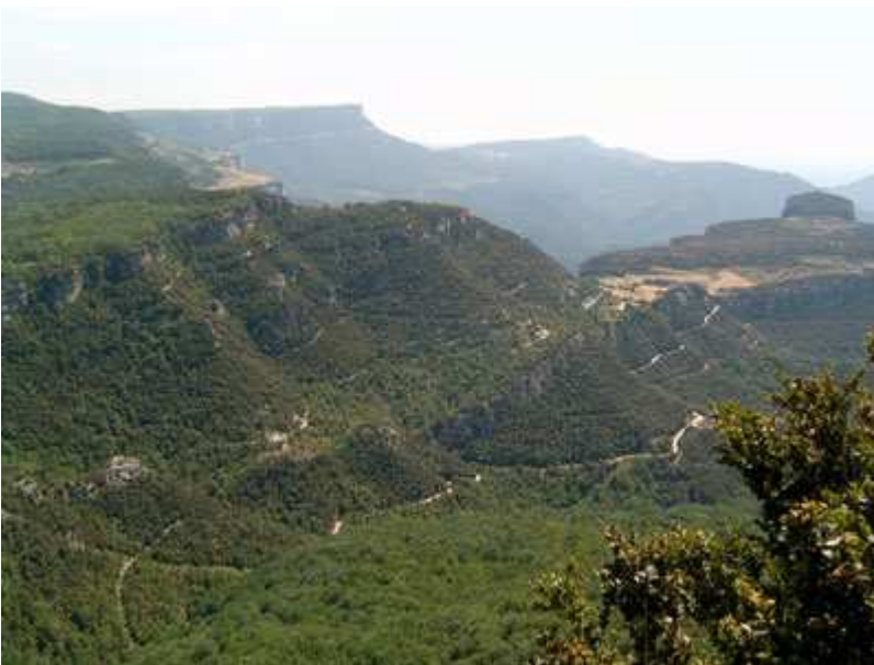
Vistas del paisaje