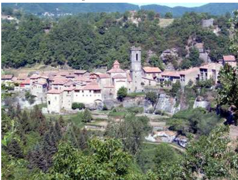
Vista de Rupit