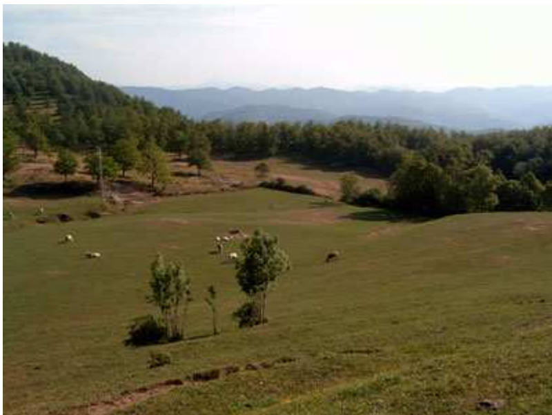
Paisajes del recorrido