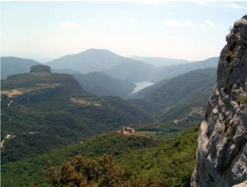
Vistas del paisaje