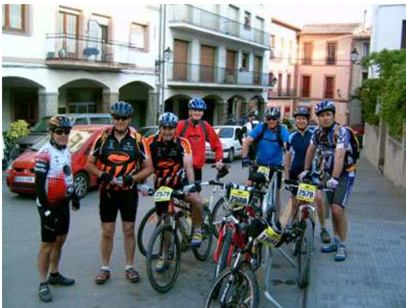
El grupo antes de iniciar la ruta

Recorrido de 55,63 km (según GPS), según la organización 60 km. y 1.858m de desnivel acumulado. En esta ocasión, de momento no puedo adjuntarte todos los mapas del recorrido. La mayor parte del recorrido lo tienes pero me faltan algunos tramos que más adelante conseguiré (si tu los tienes y me los quieres enviar, estaré agradecido) cuando vuelva de mi próxima ruta, "La ruta del Quijote", entonces procuraré colgar los mapas que faltan.