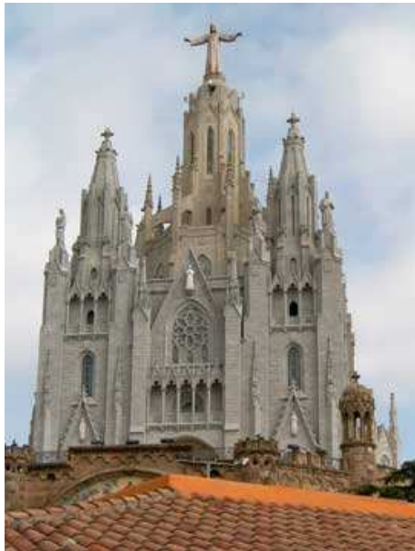
Iglesia del Tibidabo