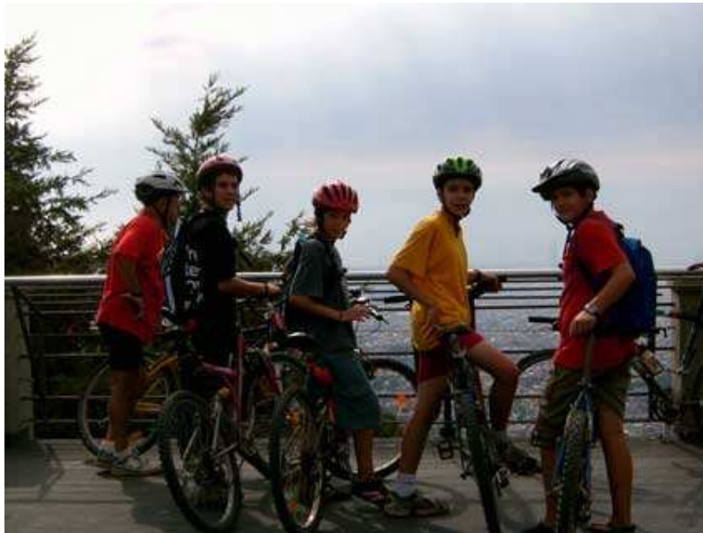
En el mirador del Tibidabo