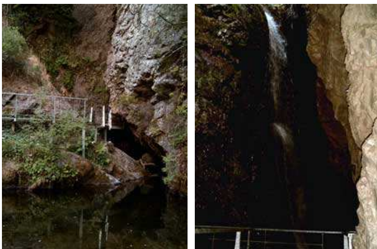
Acceso y cascada

Esta ruta no entraría dentro de lo que yo considero una ruta de BTT, puesto que la mayor parte del recorrido (excepto la subida a Sancenas), se realiza por carretera, a la cual yo soy muy contrario, aunque siempre hay excepciones, como cuando se tratan de carreteras de montaña, por lo general poco transitadas.