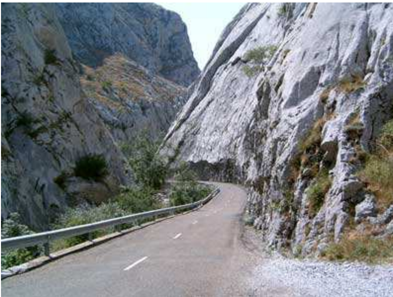
Hoces de Vegacervera