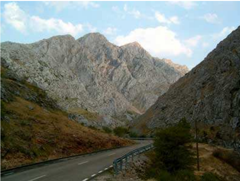
Hoces de Valdeteja