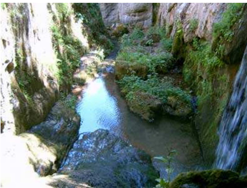
Vista desde la cueva

Antes de iniciar las hoces, descendiendo al río para visitar un rincón precioso, una pequeña cueva de la que sale un torrente, encajonado entre la roca.