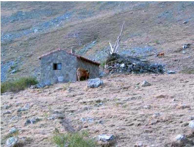
Los chozos (el actual y el antiguo)