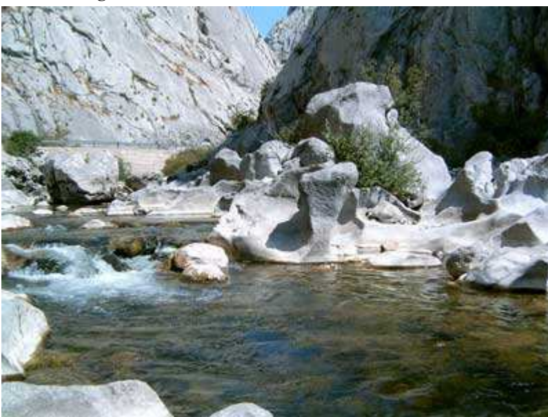
Hoces de Vegacervera

Es bonito andar de noche, cuando tu camino no tiene otro limite que el de tus pasos.