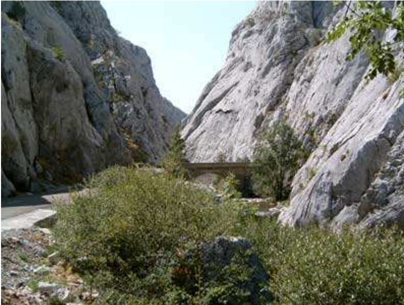
Hoces de Vegacervera