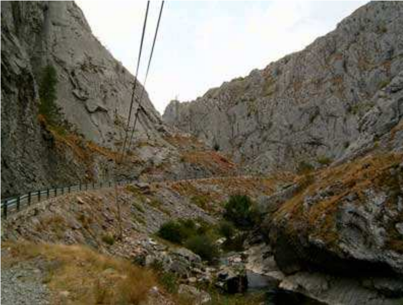
Hoces de Valdeteja