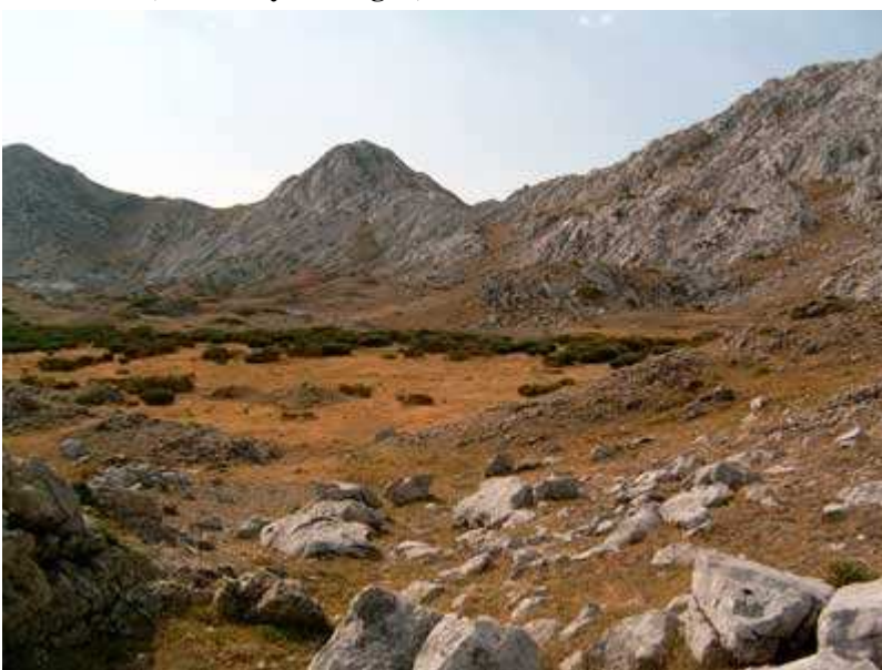
Zona de las Vizarreas