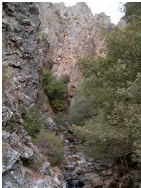
Acceso a la cascada

Robles de la Valcueva – Campohermoso – La Vecilla – Valdepiélagos - Cascada – Nocedo de Curueño – Hoces de Valdeteja – Valdeteja – Valverde – Collado de Ubierzo – Sancenas – Genicera – Lavandera – Pedrosa – Valverdin- Getino – Felmin – Acceso a la Cueva – Hoces de Vegacervera – Vegacervera- Matallana del Torío - Robles de la Valcueva.