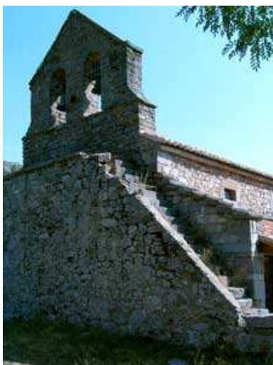
Iglesia de Genicera