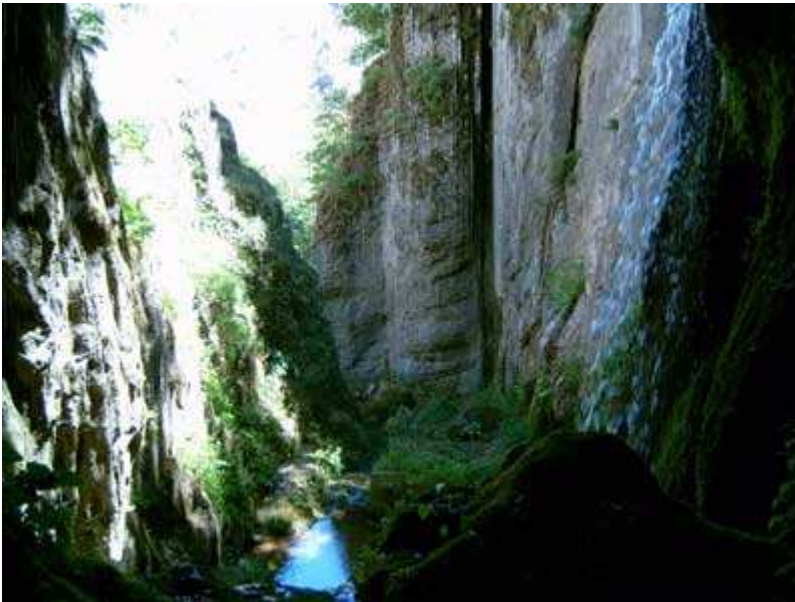
Vista desde la cueva