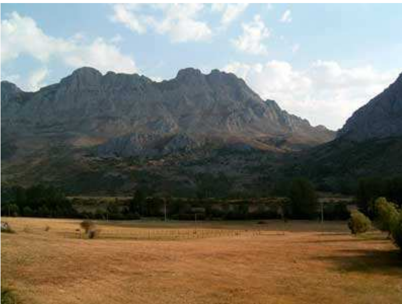
Hacia el collado de Ubierzo