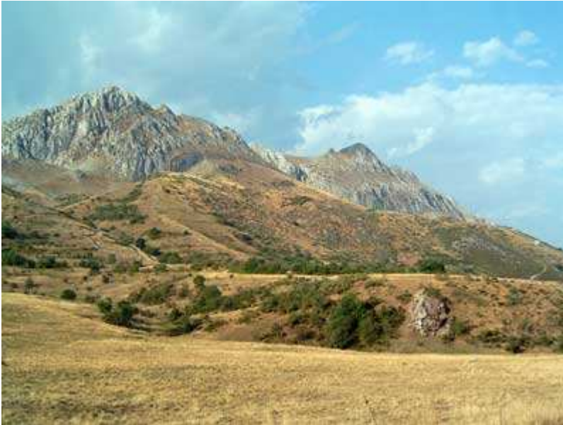
Ascensión a Sancenas