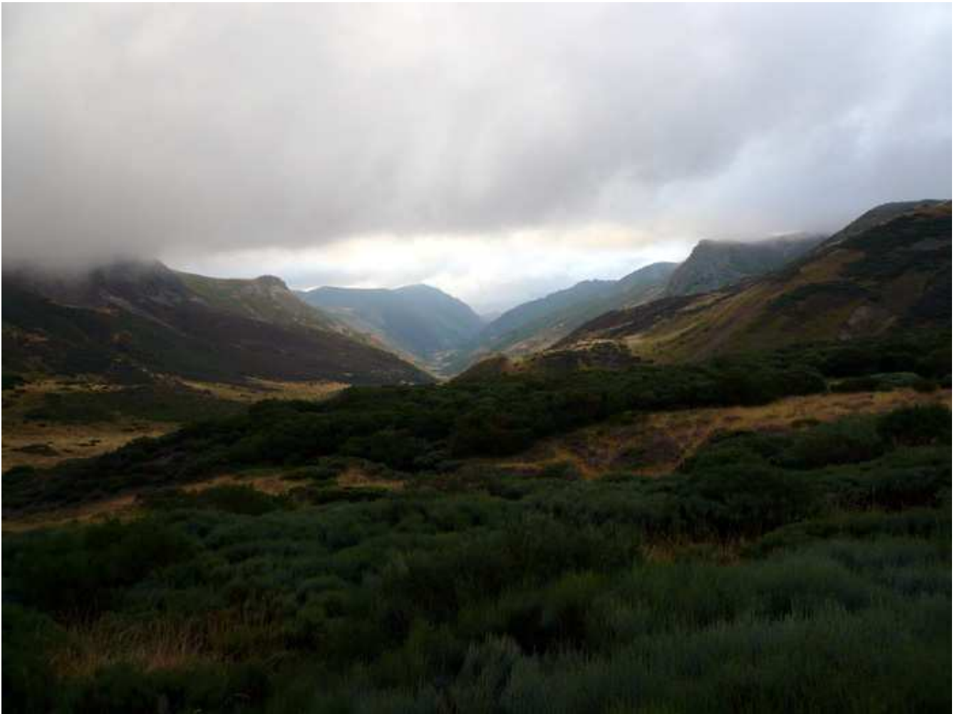
Foto 5.- Valle a seguir que se presenta desde el collado de Vega Redonda