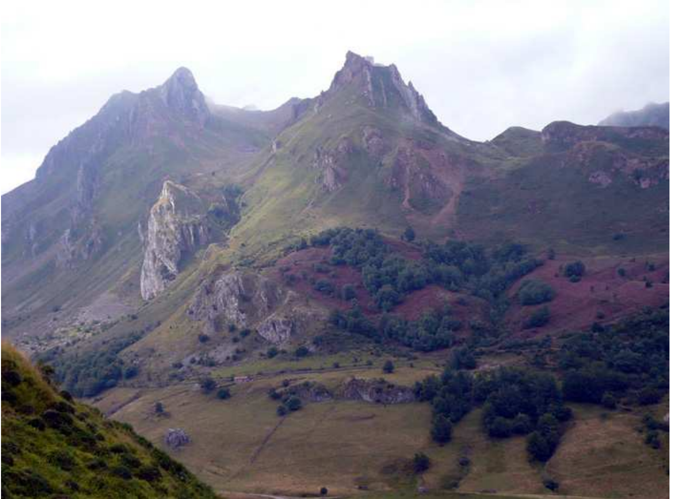
Foto 21.- Lado opuesto del valle

Observando esta foto y mirando el perfil, todavía tengo dudas de si hice lo correcto bajando por el valle, pues implicó hacer 14 km de bajada, bajando unos 700 m de desnivel y luego subir un puerto (por carretera) de aproximadamente 12 km, que se me hizo interminable.