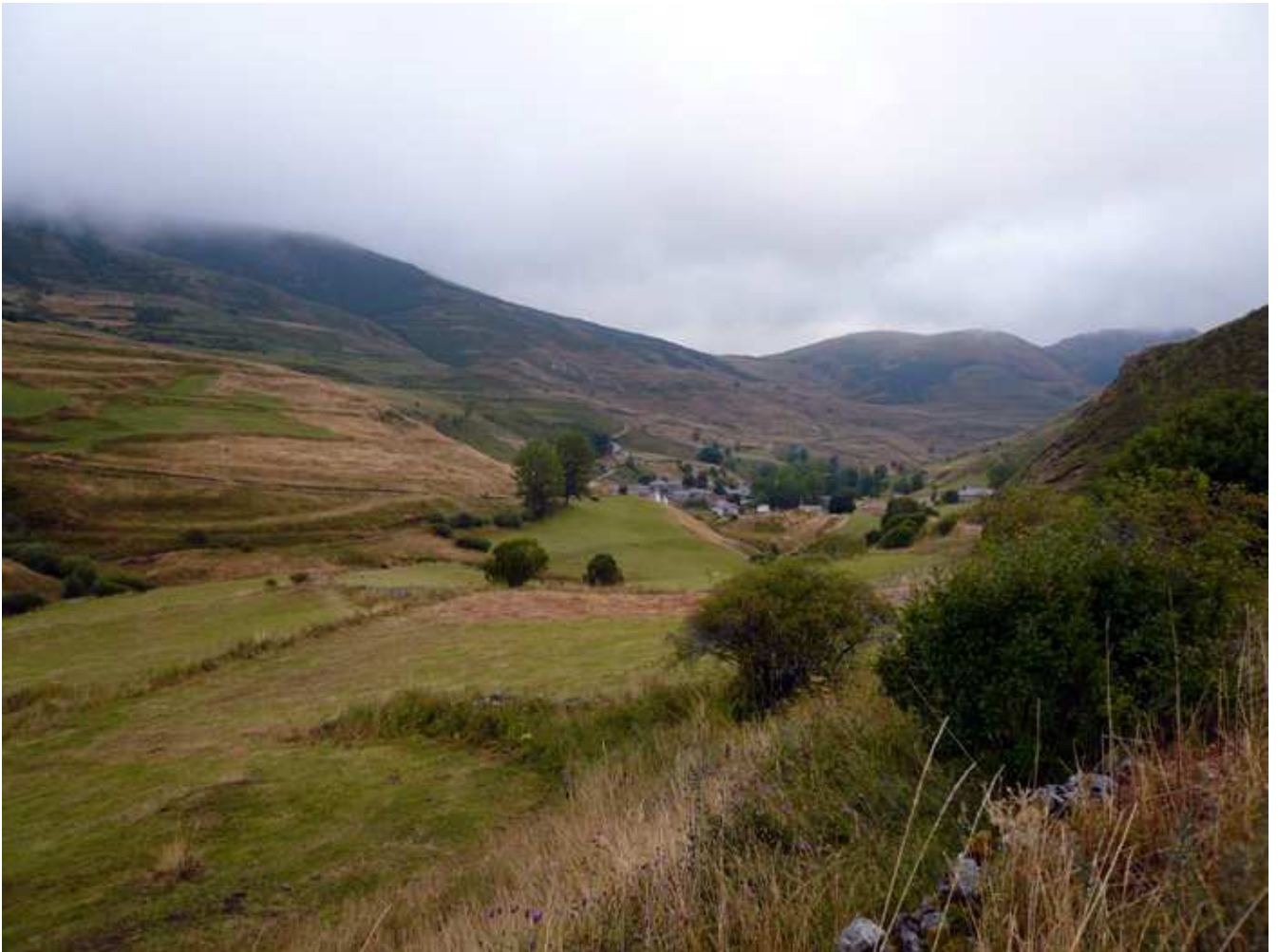
Foto 12.- Vista del pequeño pueblo de Torrestio

El cruce de Torrestio, tendremos que seguir la pista de la izquierda, iniciando la subida al primer lago. Esta subida se hace dura, especialmente en la zona del lago de la Cueva.