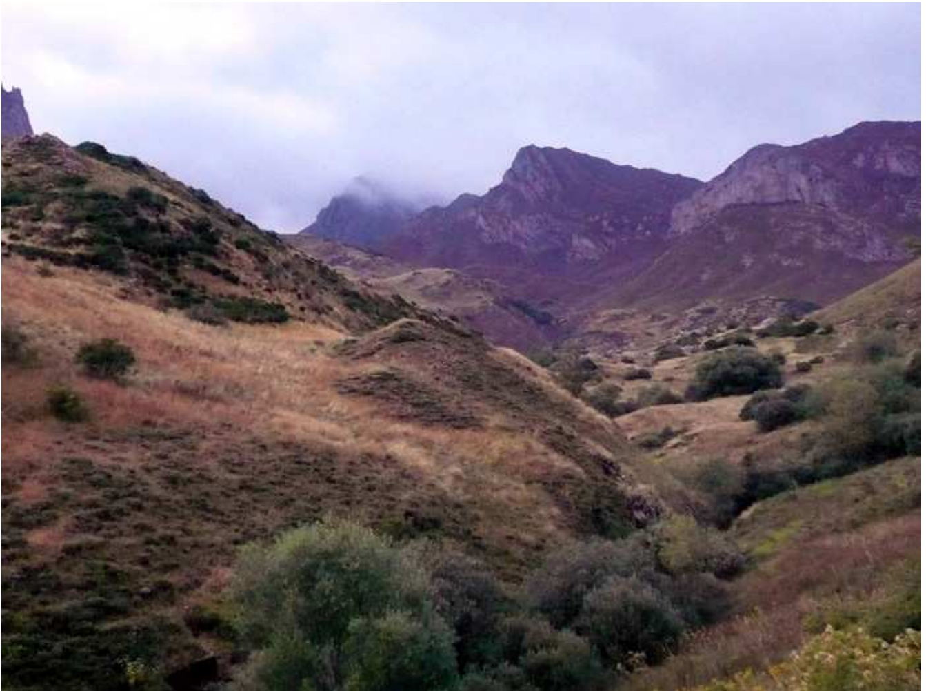
Foto 2.- Paisaje de Babia

A medida que vas subiendo, vas dejando el valle atrás, y en un ambiente solitario, donde puedes apreciar esa sensación de estar tu solo en el mundo. Hace mucho tiempo y distancia en el que el último pueblo quedó atrás.