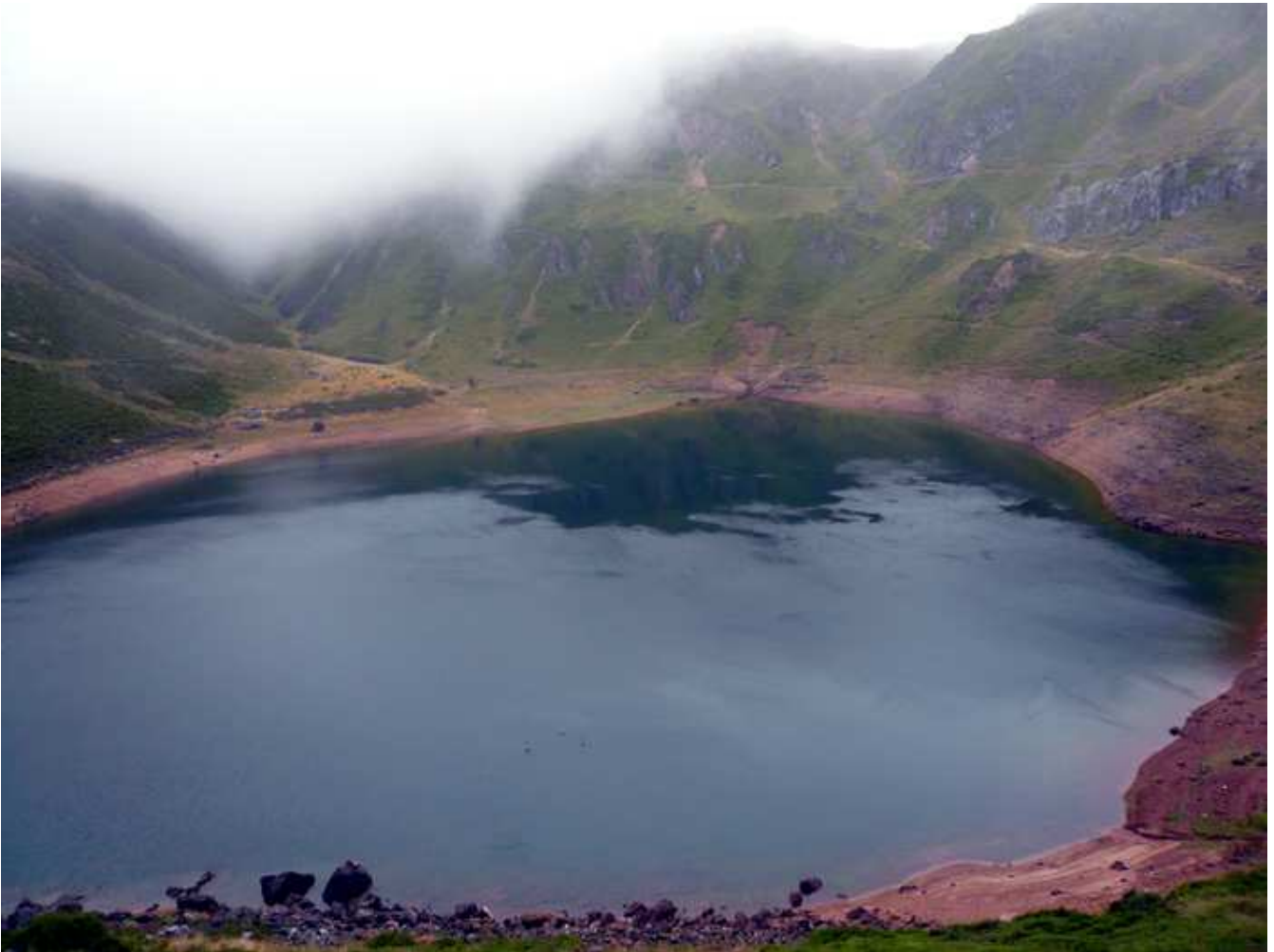
Foto 15.- Vista general del lago de la Cueva