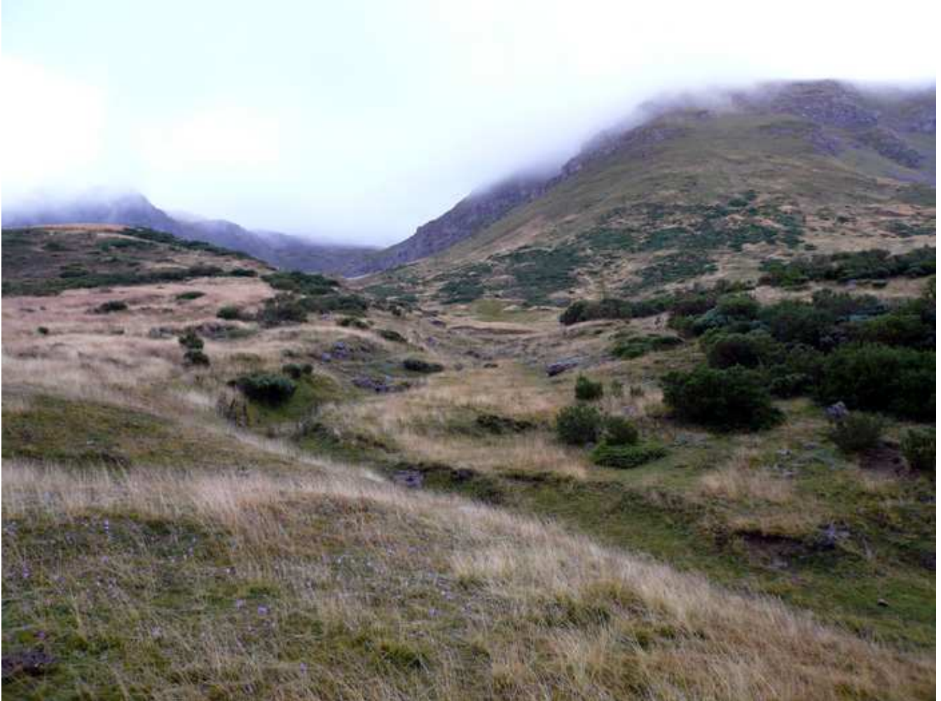
Foto 4.- Collado de Vega Redonda

Vista general desde el collado de Vega Redonda. El camino sigue para la izquierda de la imagen.