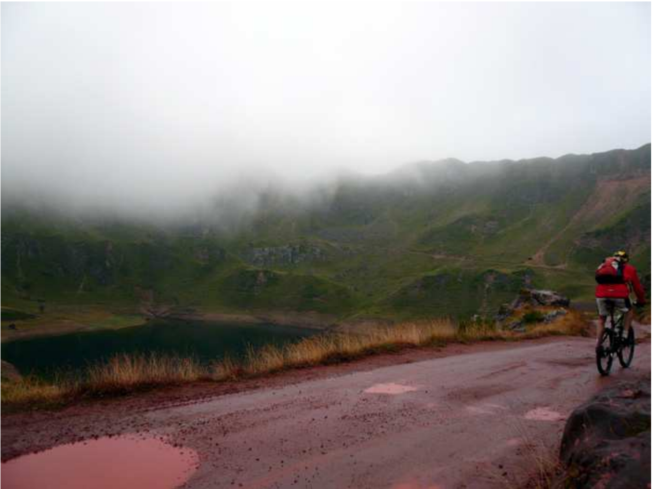
Una vista general con el lago de la cueva al fondo, en un día de niebla y lluvia.