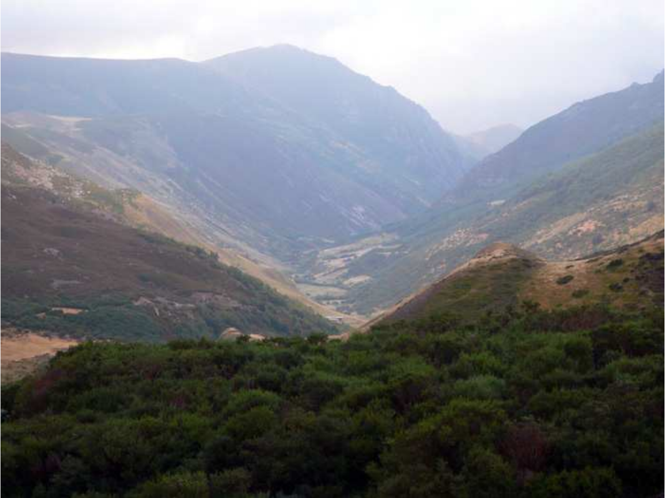
Foto 6.- Vista general