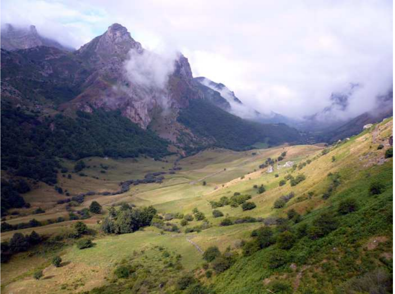
Foto 20.- Vista general del valle

Vista general del valle realizada durante el descenso y en la que se puede apreciar la fuerte pendiente de la montaña.