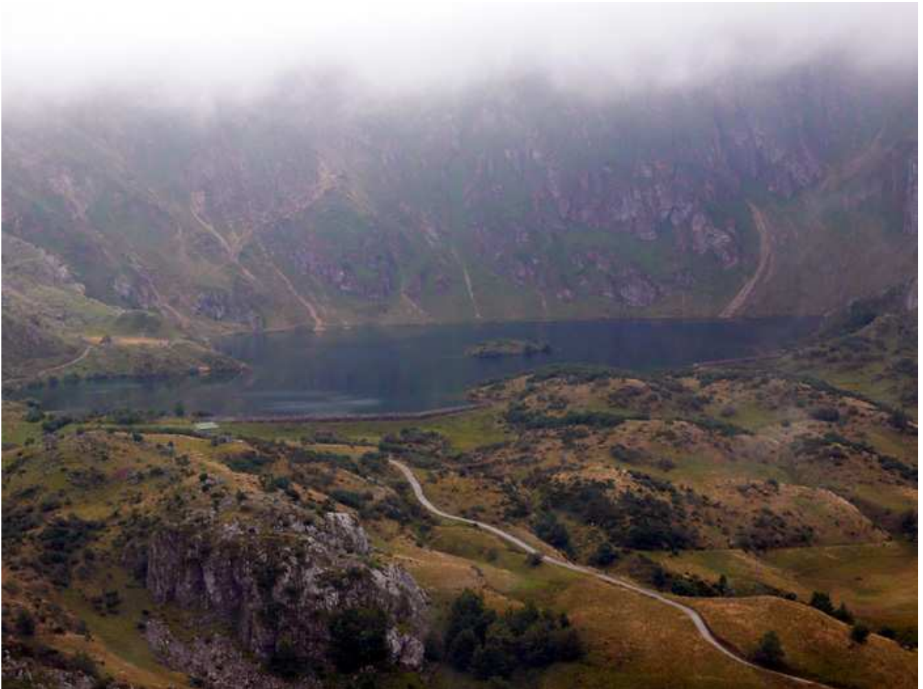
Foto 19.- Vistas del lago del Valle

Durante el descenso tenemos vistas tan preciosa como esta del lago del valle.