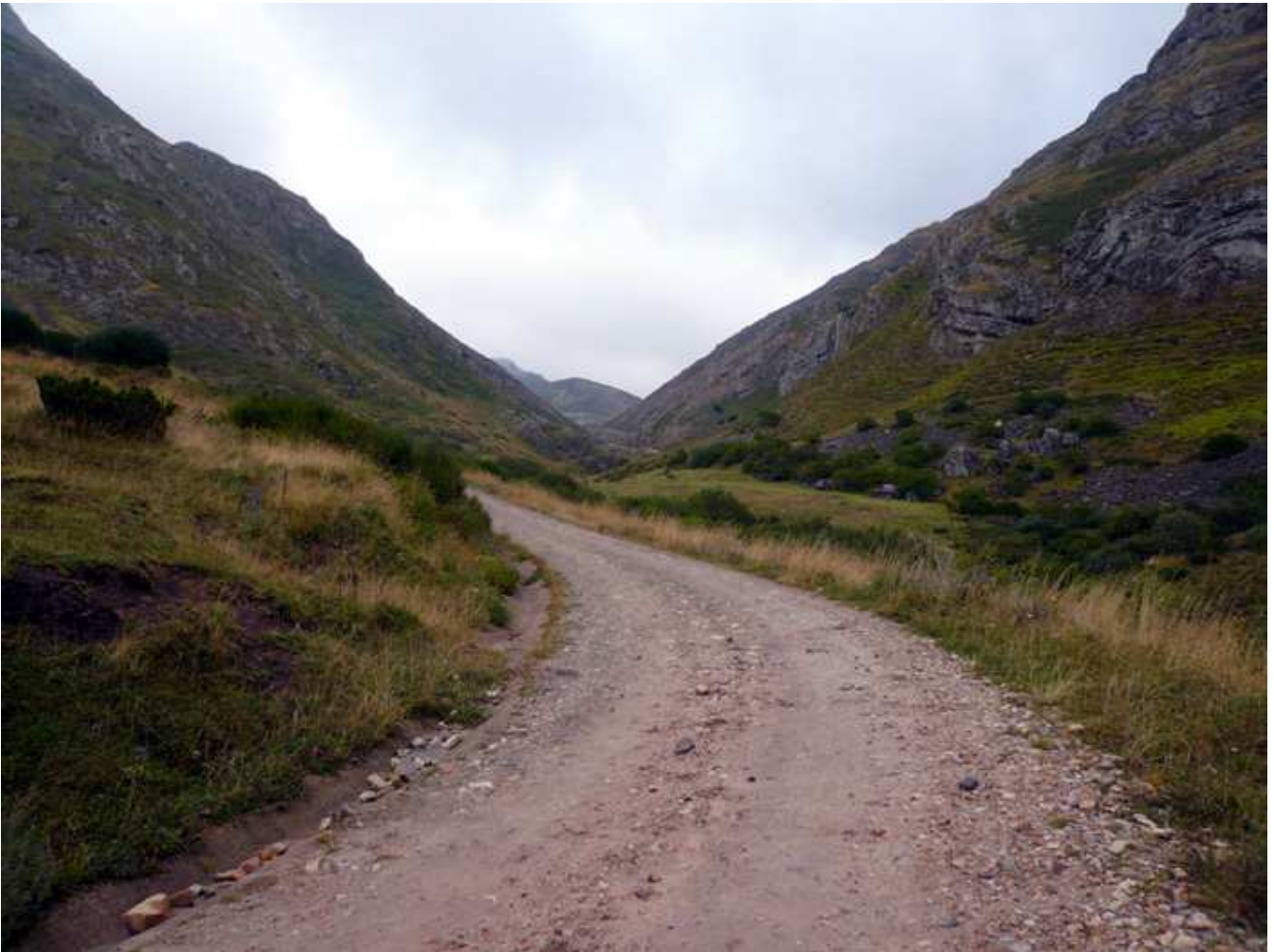
Foto 13.- Subiendo a los lagos