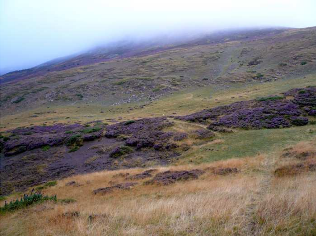
Foto 10.- Nuevo collado en la zona del Quexeiro (desaparece el camino)

Este nuevo collado lo tienes marcado con el waypoint número 2. Como puedes apreciar en la foto, el camino desaparece y lo único que se intuye entre la hierba, es un pequeño sendero, que en muchos tramos desaparece. Tendrás que seguir la marca de tu gps.