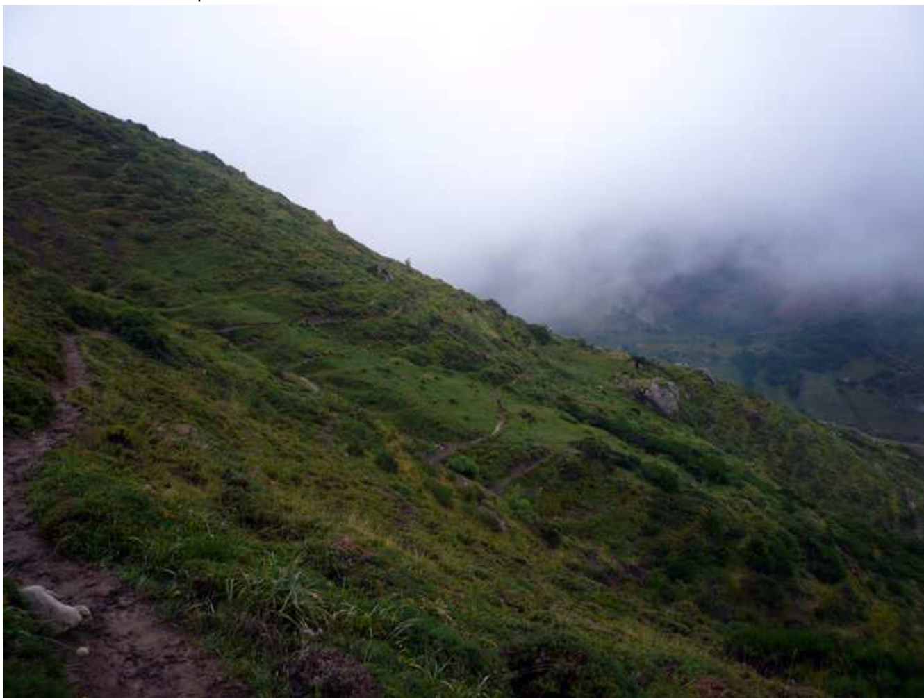
Foto 18.- Descenso por la zona de Peña Llábana

El descenso al valle, de aproximadamente 300 m de desnivel, es bastante difícil de hacer sobre la bici, por varias razones: