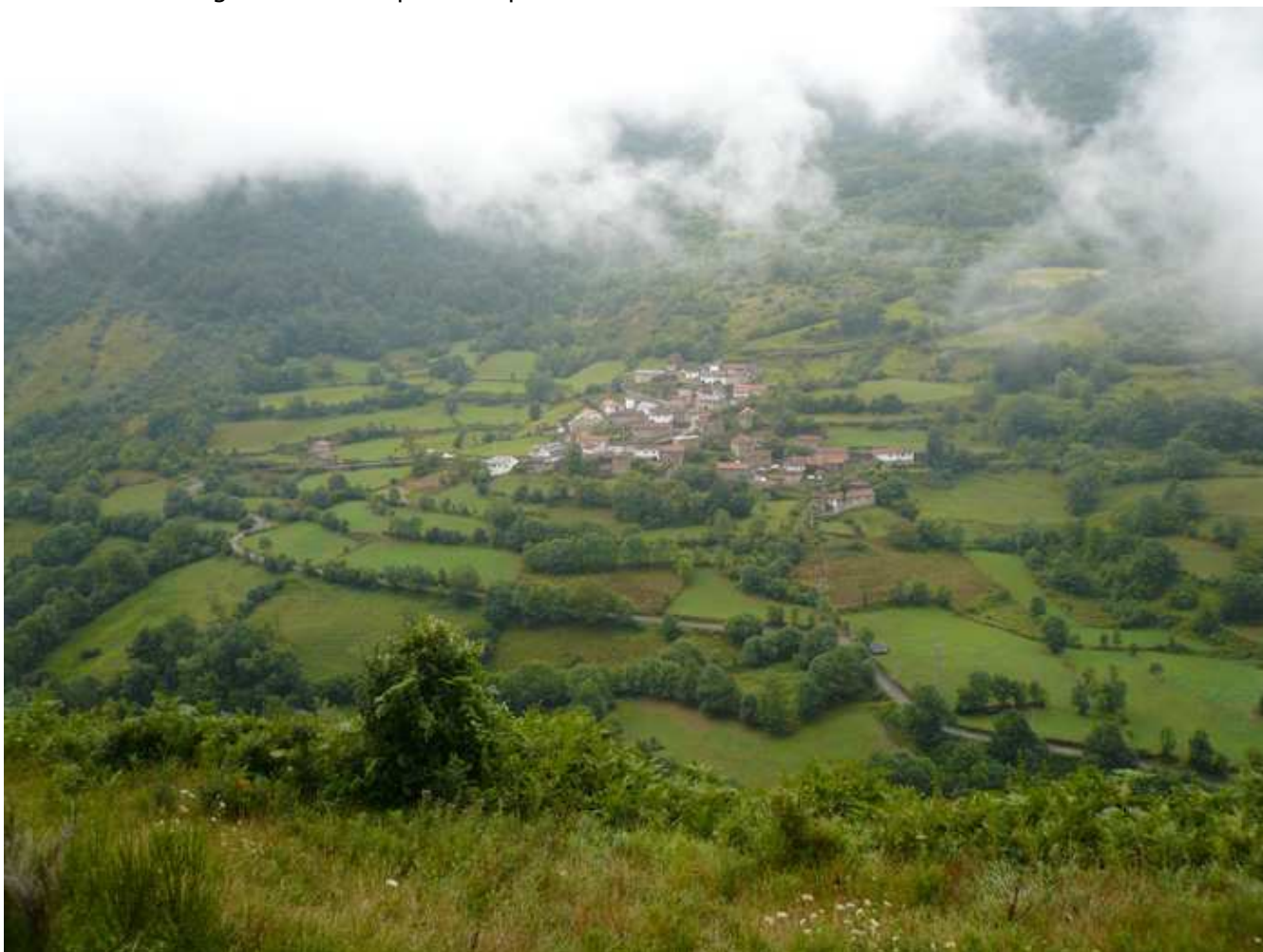
Foto 22.- Vista general de un pueblo típico Asturiano

Una vez que se coge la carretera la excursión no tiene perdida aunque se siguen viendo espectaculares paisaje como el que puedes ver en esta fotografía.