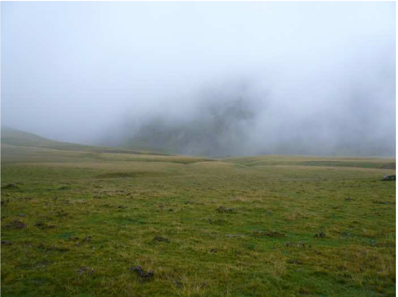
Foto 17.- Por la zona de Vega Fresnedo

En este punto se mantiene la altura en una planicie, donde las vacas pastan libres y protegidas por grupos de mastines leoneses. En este lugar tuve mi segundo encuentro con un grupo de estos perros los cuales salieron de entre la niebla ladrando en busca mía los cuales me rodearon en tono amenazador y donde lo pase fatal. No tuve más remedio que aplicar el consejo del buen pastor, bajarme de la bici y comenzarles a hablar, para tranquilizarlos. Pero el que parecía el dominante del grupo, pues era el más grande y viejo, seguía acercándose a mí en un intento de olisquearme, momento que aproveche para acariciarle la cabeza y hablarle en tono tranquilizador. Creo que este viejo animal buscaba simplemente unas caricias de una persona.