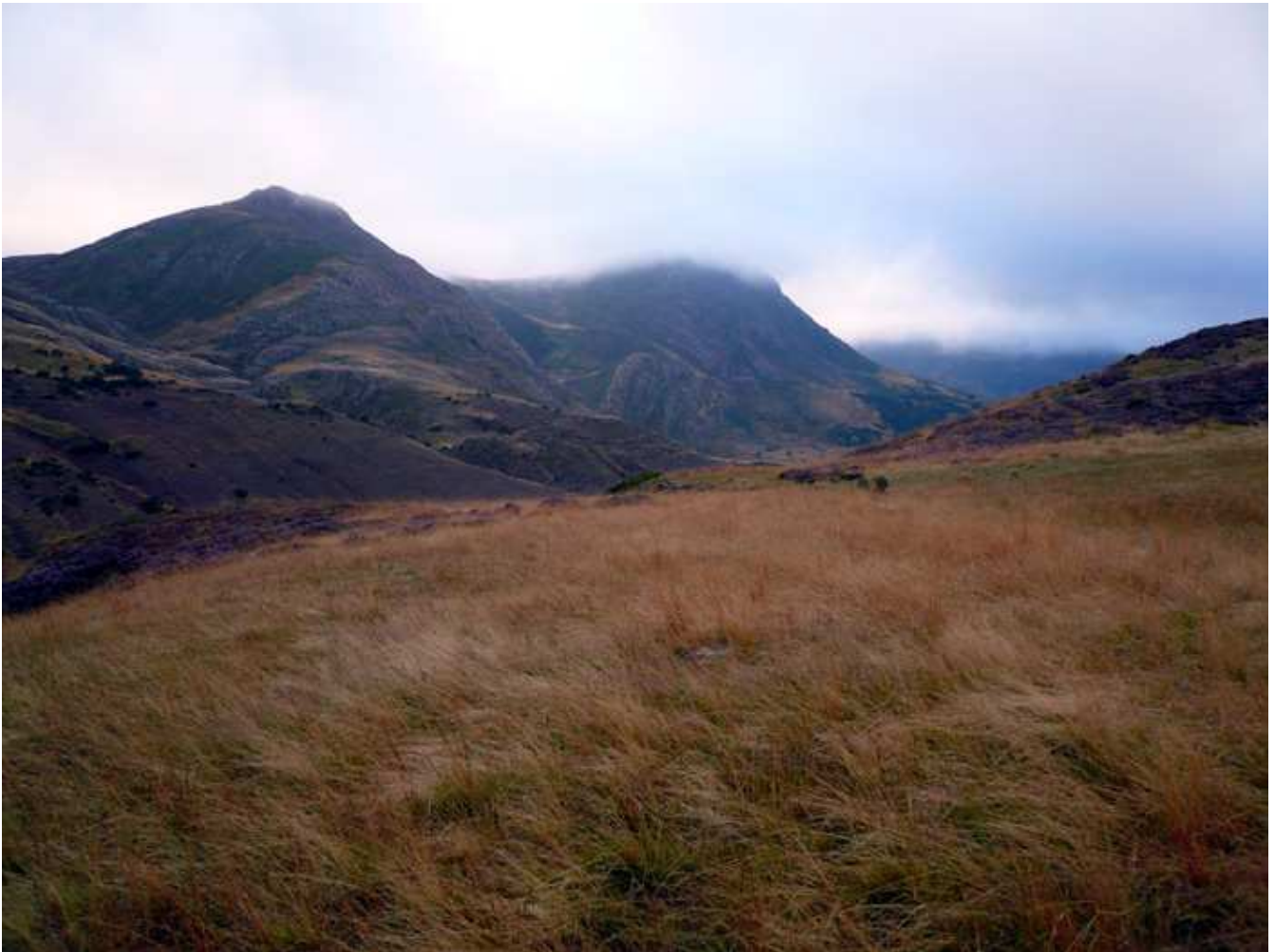
Foto 11.- Tramo sin camino definido

Otro ejemplo del camino a seguir entre los waypoints 2 y 3. Es un manto de hierba que en este caso puede ser ciclable, pero que el sendero seguirá bajando hasta cruzar el arroyo de Valverde, para luego subir (bici al lado) en busca de la pista. Esto ocurre en el waypoint 3.