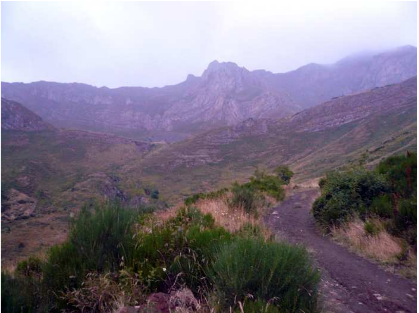
Foto 3.- Vista desde las proximidades del collado de Vega Redonda

Una nueva vista de los valles que se dejan atrás cuando estamos apunto de llegar al primer alto de la ruta, el collado de Vega Redonda.