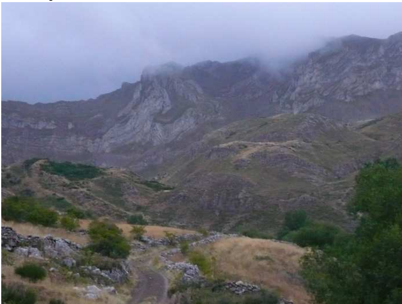
Foto 1.- Lugar donde terminó la ruta de Somiedo. Parte I

Este es el punto, aproximadamente, donde terminé la excursión de Somiedo. Parte I, y que ahora tomo como punto de partida. En esta ocasión sin nieve.