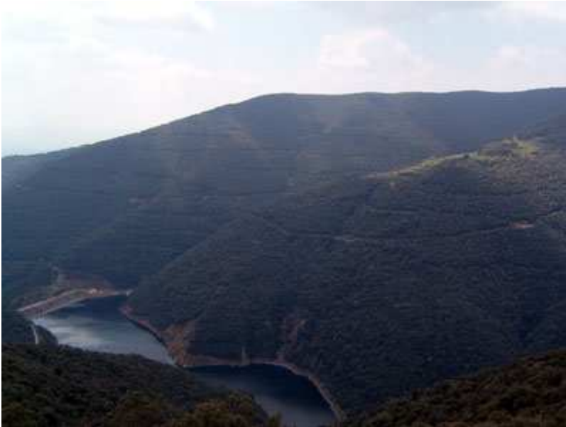
Pantano de Vallfornès