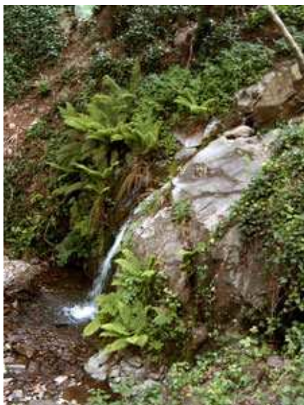
Torrente de la Baga d'en Cuc