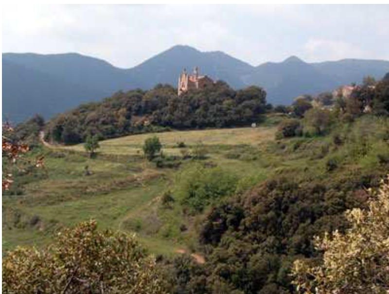
Vista de Sant Salvador