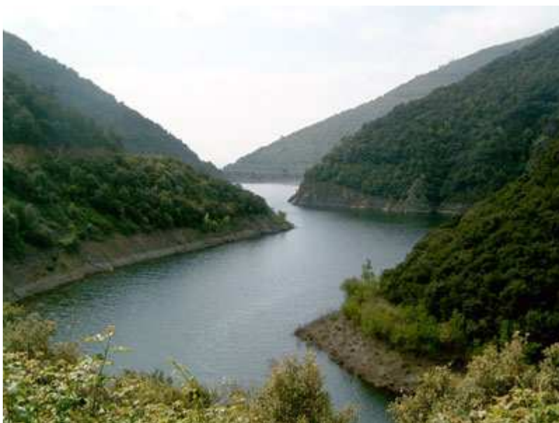
Pantano de Vallfornès

Zona de parking de la pista que va de Cànovas al pantano de Vallfornès (existe una cadena) - Pantano de Vallfornès - Torrent de la Baga d'en Cuc - Castanyer gros d'en Cuc - Baga d'en Cuc - Can Cuc - Ermita de Sant Salvador de Terrades - Riera de Vallfornès - Zona de Parking.