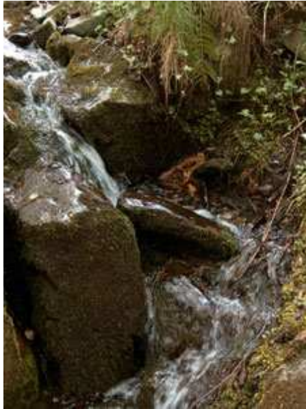
Torrente de la Baga d'en Cuc