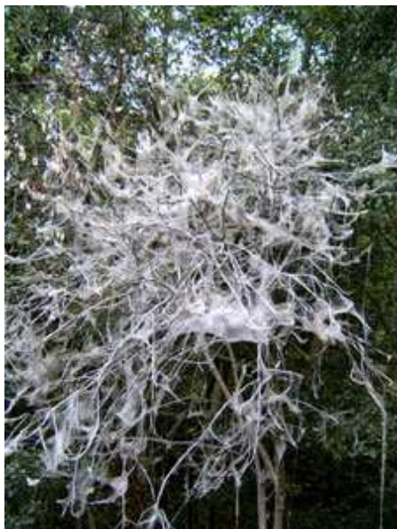
Arbol muerto por los gusanos