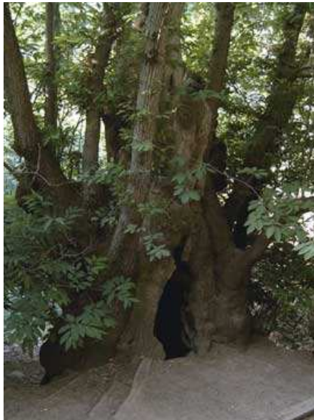
Castanyer d'en Cuc