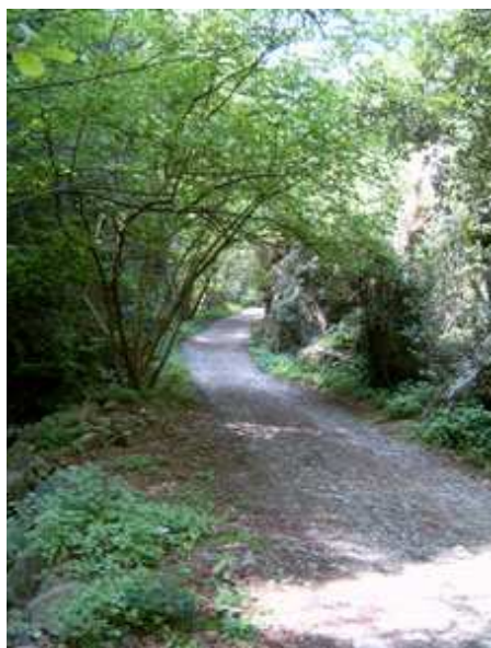
Pista del torrente de la baga d'en Cuc

Cruzamos el parking siguiendo por la pista, en dirección al pantano de Vallfornès, al que llegamos después de subir un tramo de fuerte pendiente de aproximadamente 700 metros. Una vez alcanzado el pantano, la pista bordea el mismo manteniendo la altura.