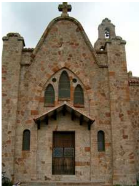
Sant Salvador de Terrades