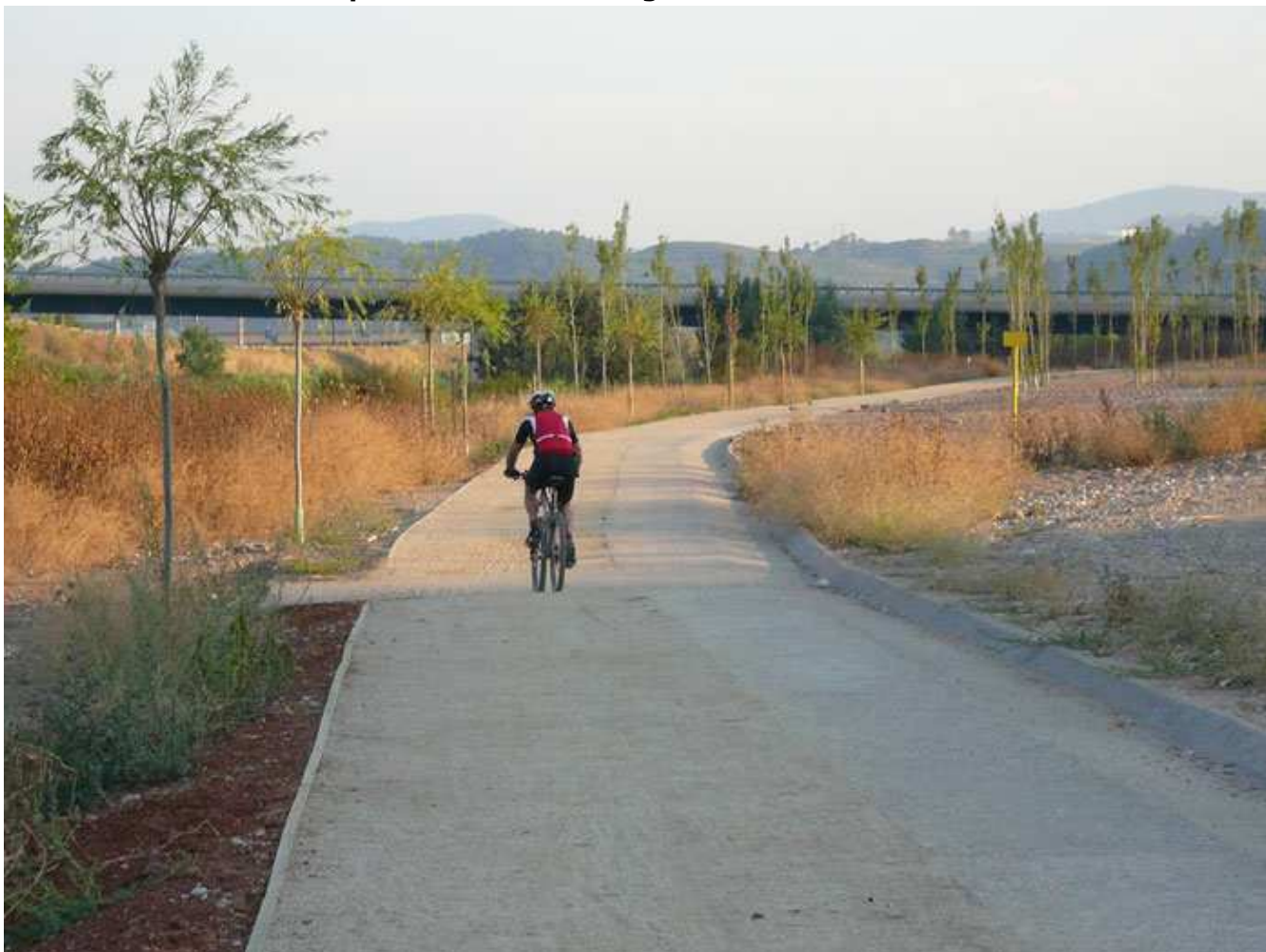
Foto 1.- Pista realizada paralela al río Llobregat