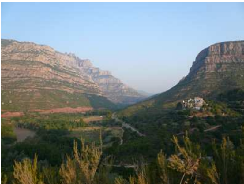
Can Benet y Can Tobella