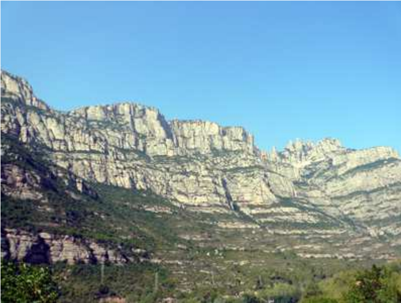
Otra vista general de la montaña de Montserrat