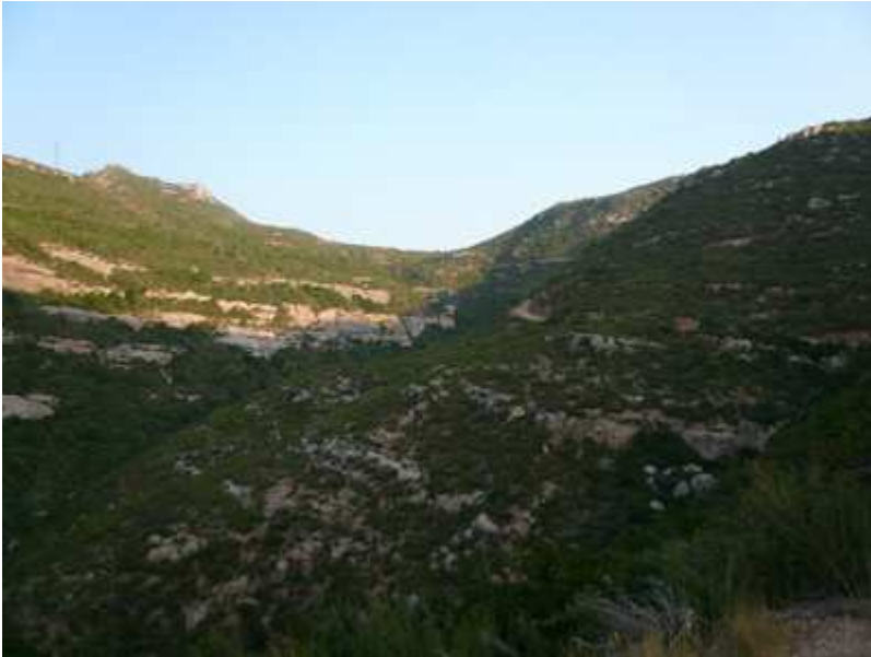
El Coll de les Bruixes

El sendero que va desde el Aeri hasta la Puda es un sendero con una ligera tendencia a subir, pero que se hace de forma muy agradable, por los continuos toboganes que tiene. Este sendero enlaza con la pista que sube al Coll de les Bruixes, tramos que ahora realizaremos de bajada.