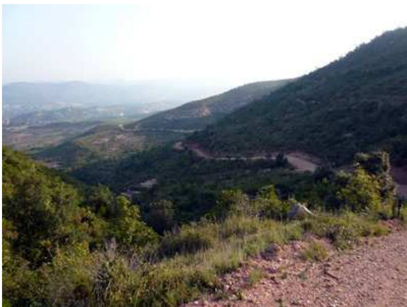
Al otro lado del Coll de les Bruixes