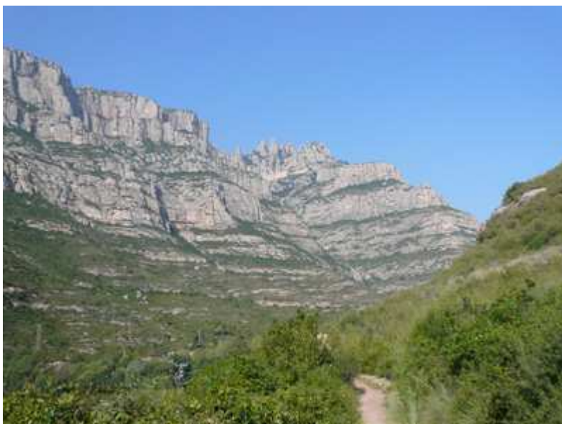
Vistas a la montaña de Montserrat