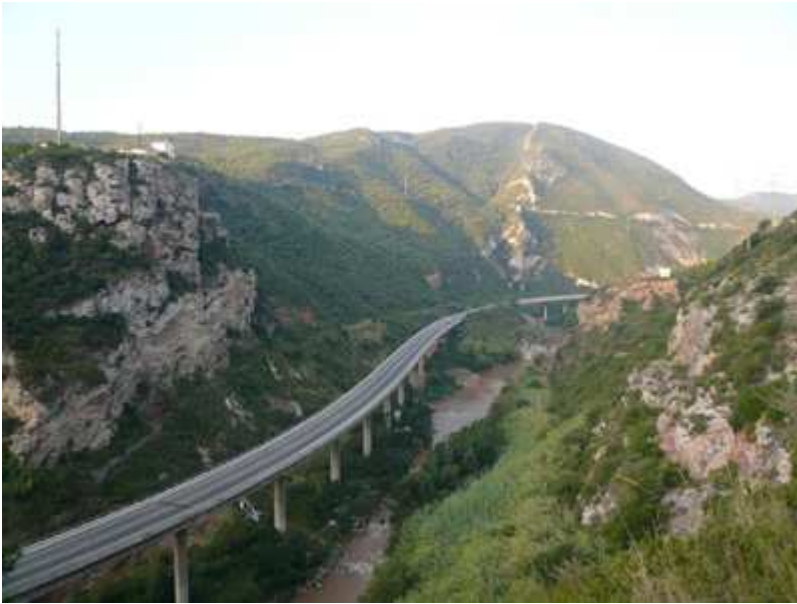
Vistas desde la Puda

Olesa de Montserrat - Ctra. C-55 - La Puda de Montserrat - Coll de les Bruixes - Bosc del Bovet - El Ventaiol - Monistrol - Estación del Aeri (Teleférico de Montserrat) - Serra de l'Abat - Can Benet - La Puda - Olesa de Montserrat