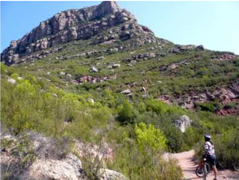
Por el sendero del Aeri