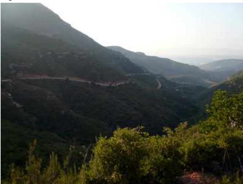
Vista de la pista que hemos ido subiendo http://www.bttysenderismo.com