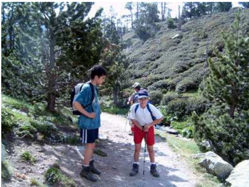
Iniciamos la excursión, por el sendero que sale de la carretera.