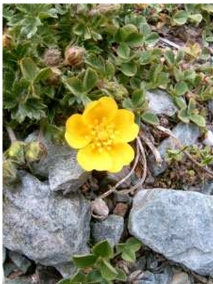
Una flor de la zona