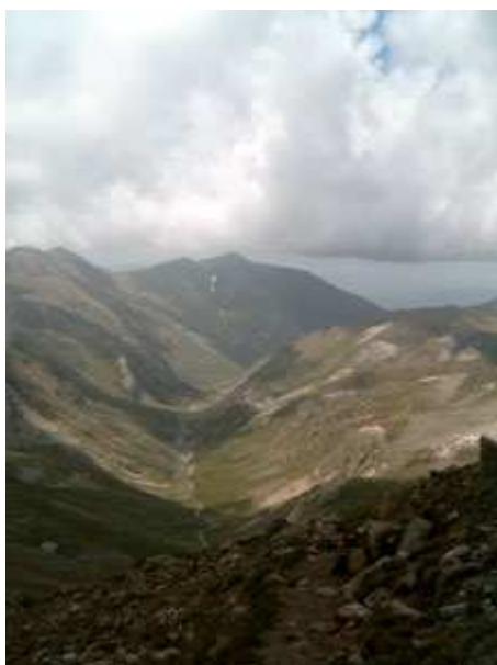
Vista de la Coma del Freser

Iniciamos la ascensión al Pic de Bastiments, donde a David, el más pequeño, se le iba a hacer un poco pesada la subida.