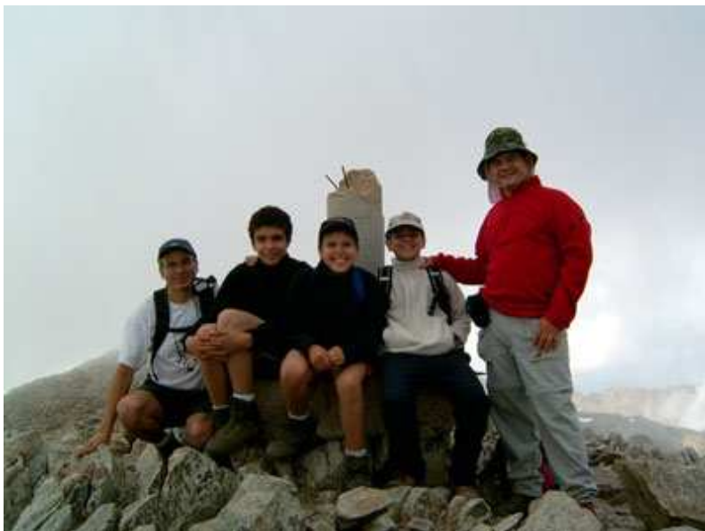
Foto del grupo con el objetivo conseguido. Pic de Bastiments