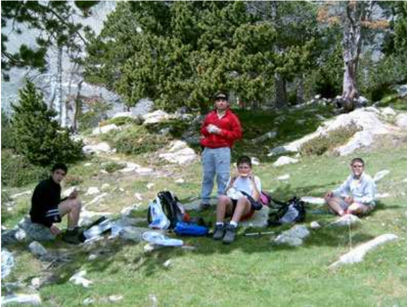
Almorzando en las proximidades del refugio

Al llegar al refugio hacemos una parada para reponer fuerzas y comer algo, pues era hora de almorzar. Teniendo en cuenta que habíamos madrugado mucho para iniciar nuestra excursión temprano, era la excusa perfecta para comer nuestro bocata.