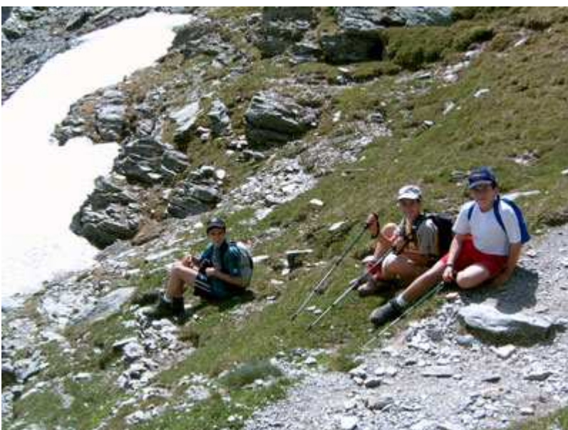
Un descanso a punto de culminar el Coll de la Marrana

Una vez repuestas las fuerzas, seguimos nuestra ascensión, cuyo próximo objetivo es subir al Coll de la Marrana.