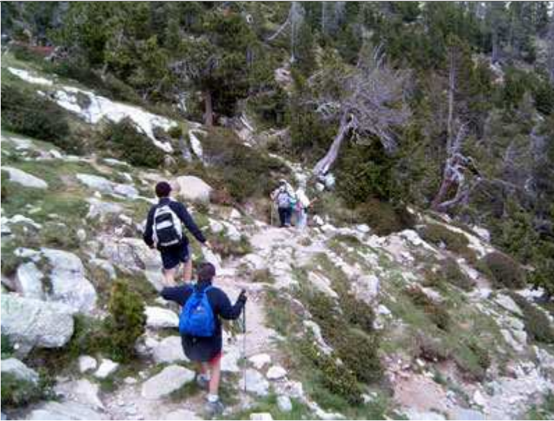
Descenso desde el refugio al parking