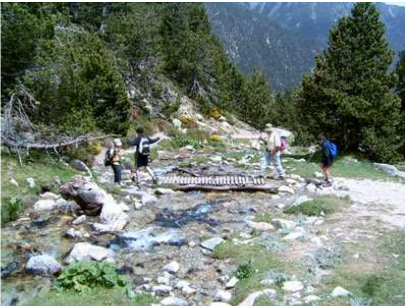
Descenso del refugio