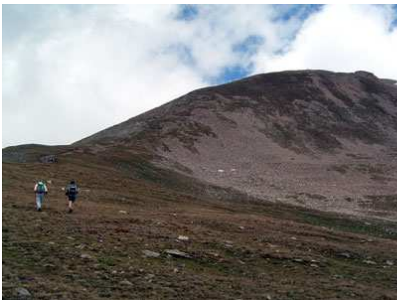
Inicio de la ascensión al Bastiment desde el Coll

Desde el coll de la Marrana, tenemos vistas muy bonitas. Una de ellas es el tramo final que nos falta para llegar al pico de Bastiments.