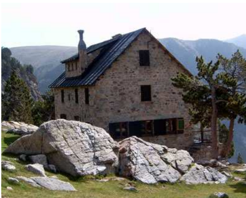
El refugio de Ulldeter