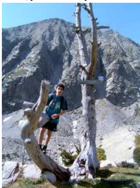
Ferran y al fondo el Gra de Fajol

pues transcurre entre los árboles y existe abundante agua. Se podría decir que el primer tramo es llegar al refugio de Ulldeter, tramo corto de aproximadamente media hora y a partir del cual desaparece la vegetación, como consecuencia de la altura.